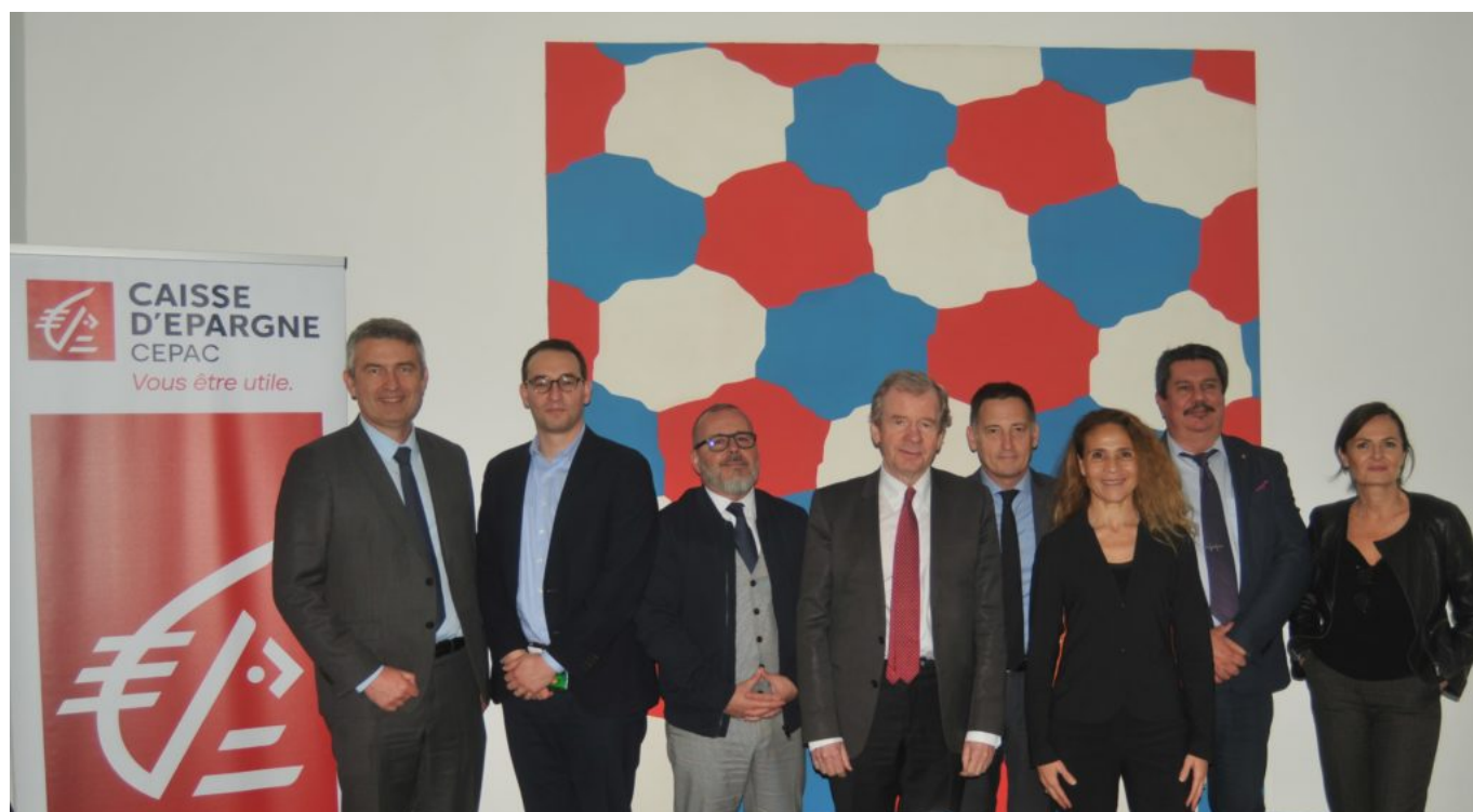
Les représentants de la Cepac et ceux de la Collection Lambert.