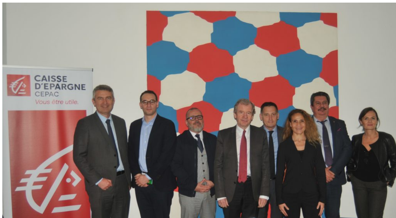
Les représentants de la Cepac et ceux de la Collection Lambert.