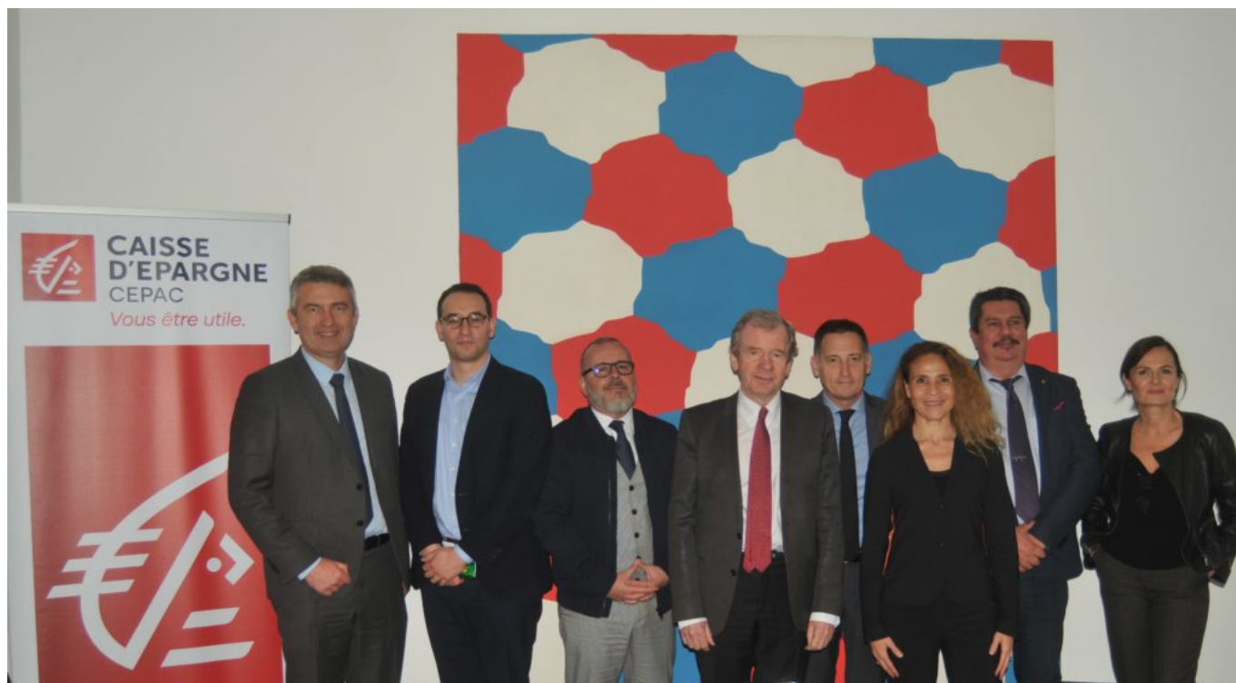
Les représentants de la Cepac et ceux de la Collection Lambert.

Ecrit par Laurent Garcia le 7 avril 2022