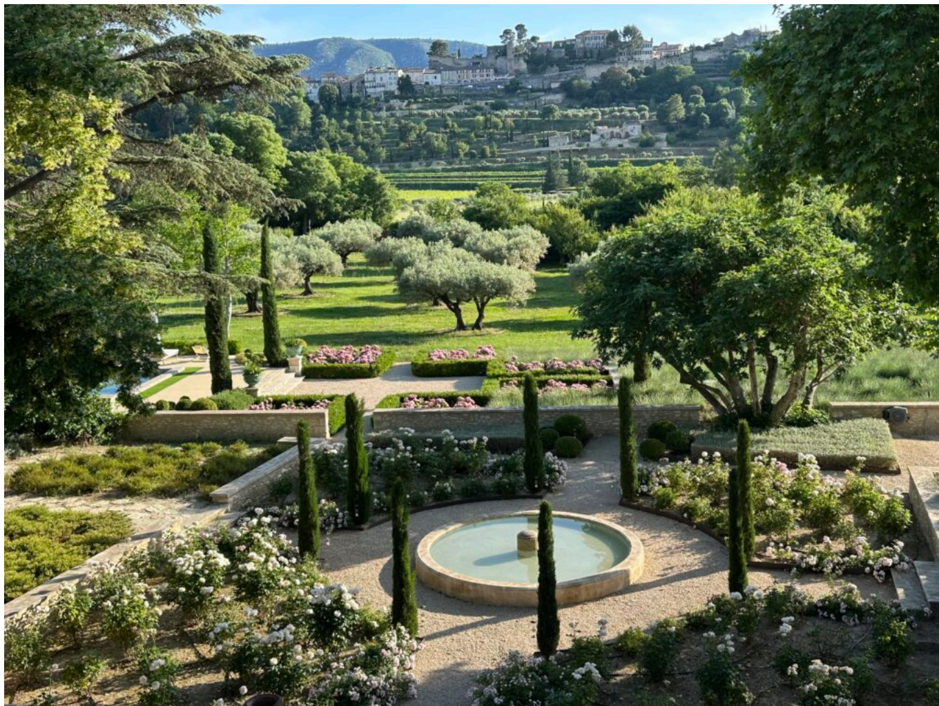
Le Domaine d'exception du Fortin, les jardins de la luxueuse maison d'hôtes.

Ecrit par Mireille Hurlin le 4 août 2025