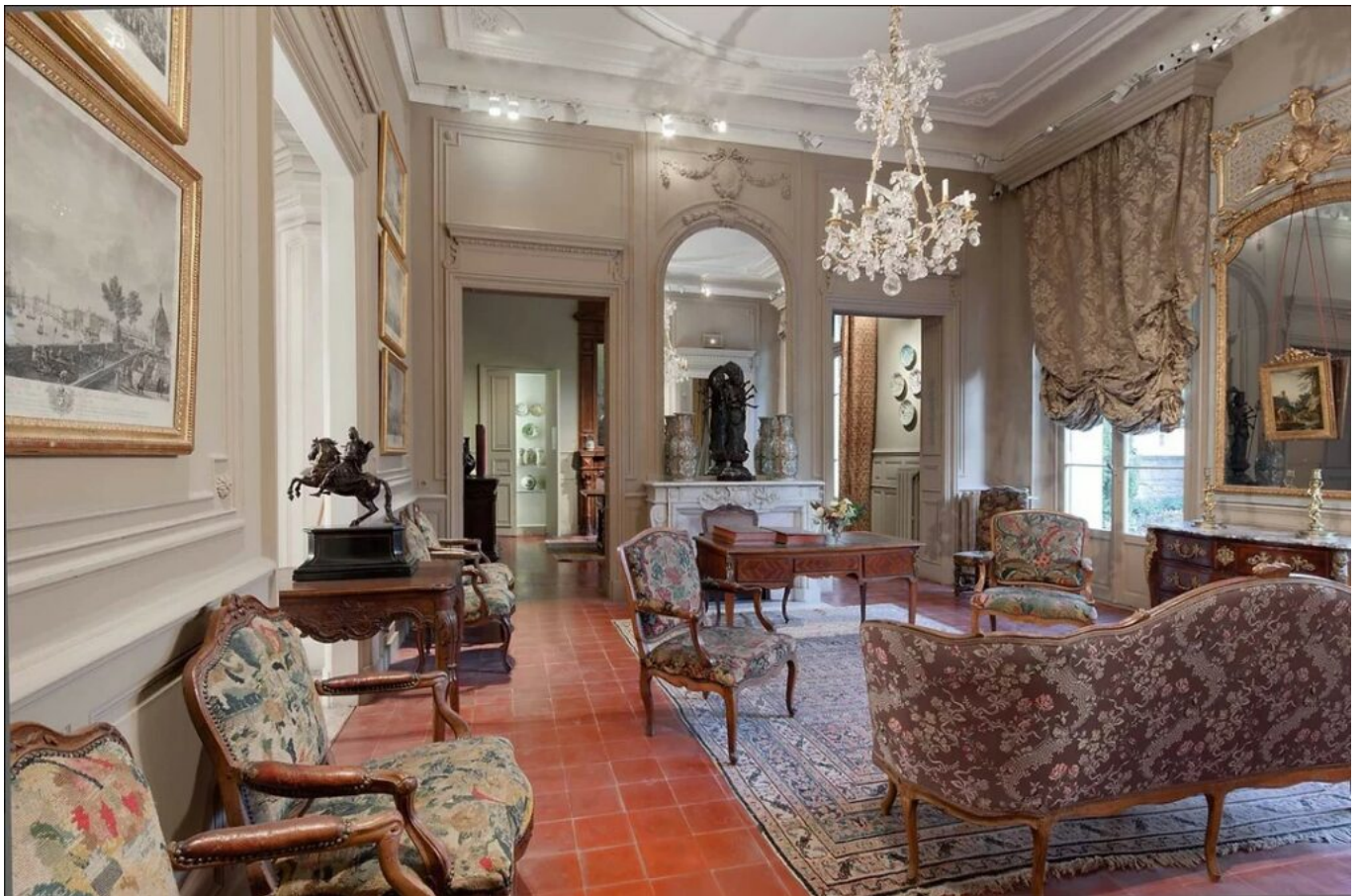
Un des Intérieurs du Musée Vouland

Sous les étoiles. Mardi 30 août à 20h30. En cas d'intempéries, la soirée sera reportée au 31 août Tarif : Adhérent 18 €, Non adhérent 20 €, Jeune (- 26 ans) 15€. Réservation au musée, 17, rue Victor Hugo, de 13h à 18h (sauf lundi) ou en ligne /HelloAsso AMLV.