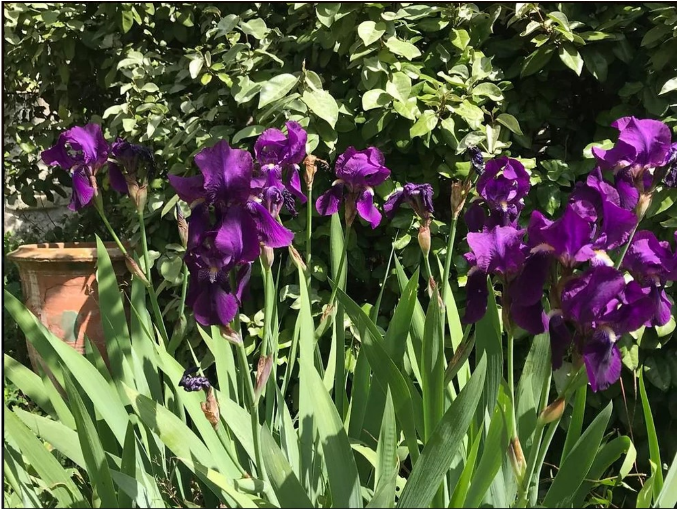
Jardin fleuri du Musée Vouland