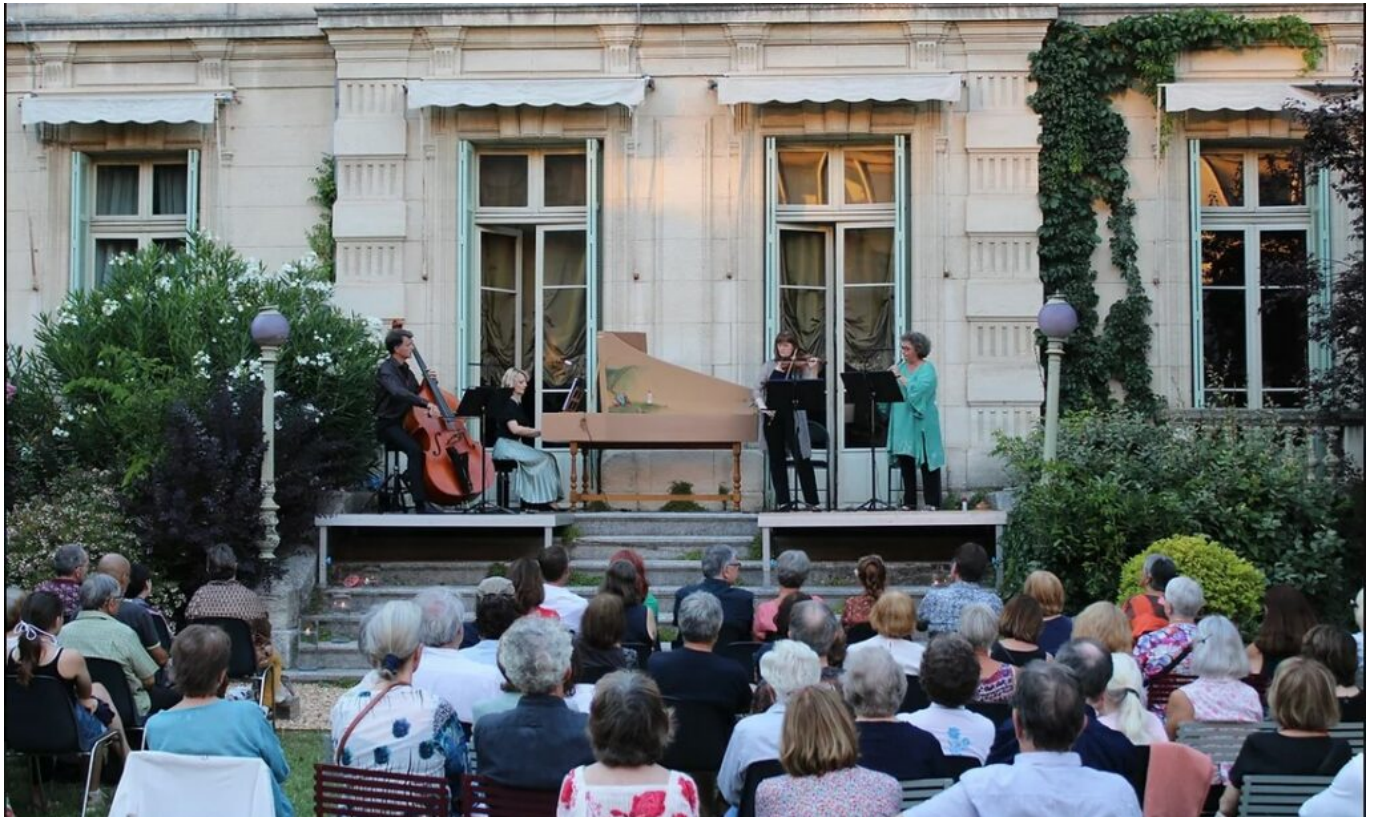
Concerts dans le jardin du Musée Vouland

Jeudi 18 août à 19h. Tarif: participation libre et solidaire prix conseillé 12€. Réservation : 04 90 86 03 793