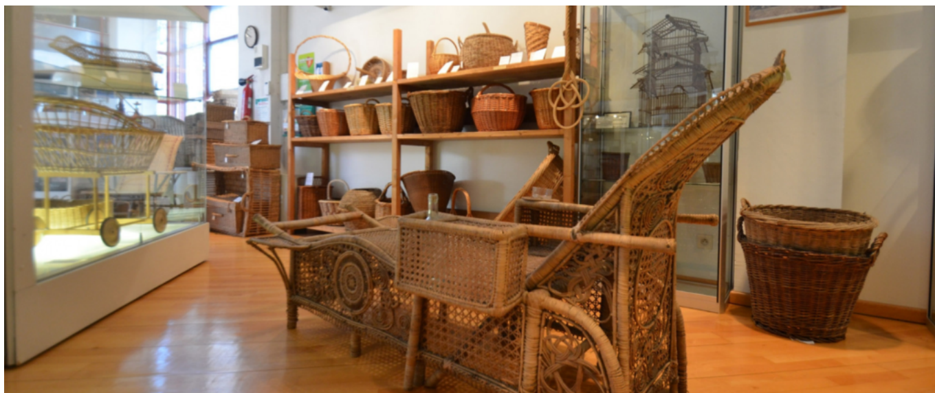
Musée de la vannerie à Cadenet

Samedi et dimanche de 14h à 17h. Entrée libre du musée : samedi et dimanche de 11h à 13h et de 14h à 18h. Avenue Philippe de Girard à Cadenet. Renseignements au 04 90 68 06 85.