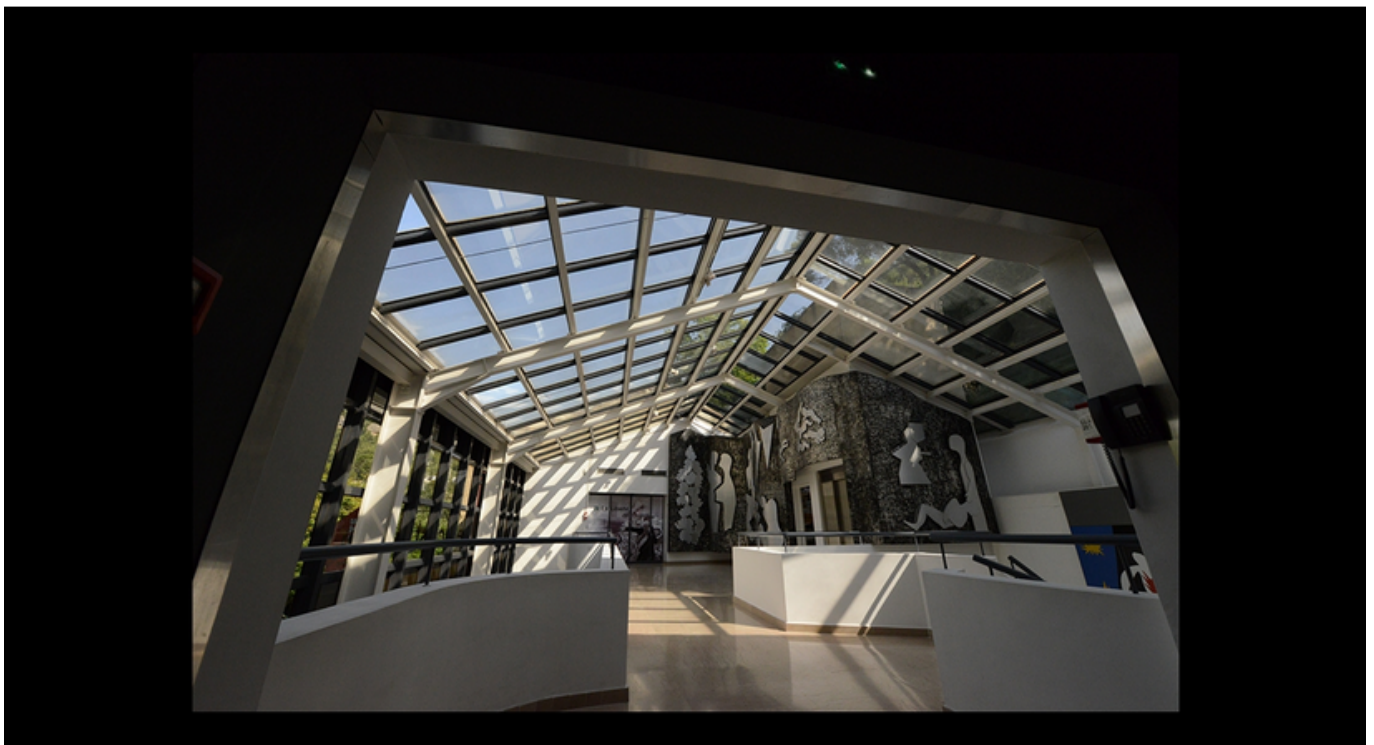
Extension du musée Jean Garcin à Fontaine-de-Vaucluse

Samedi et dimanche à 11h. Réservation 04 90 20 24 00. Entrée libre du musée le samedi et le dimanche de 11h à 13h et de 14h à 18h.