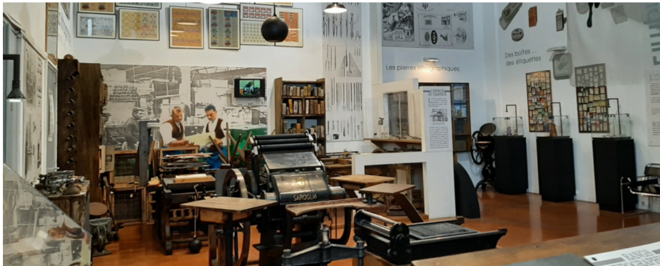
Musée du cartonnage à Valréas

Samedi à 11h, sur inscription au 04 90 35 58 75.