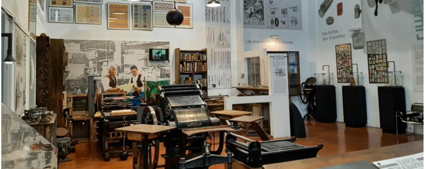
Musée du cartonnage à Valréas

Samedi à 11h, sur inscription au 04 90 35 58 75.