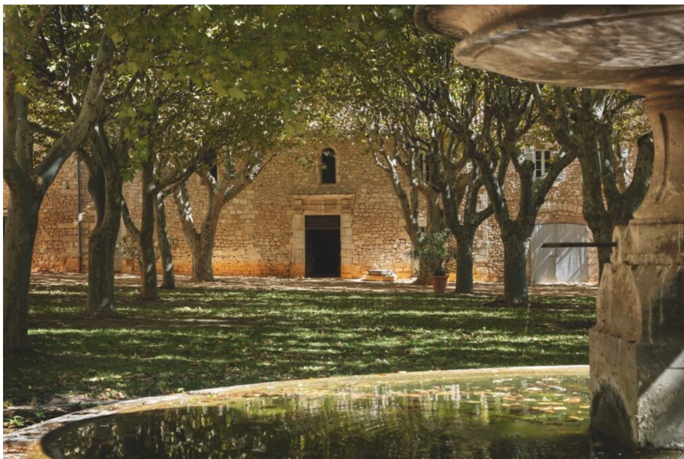
Cour du château Calissanne

Ecrit par Andrée Brunetti le 23 juillet 2025