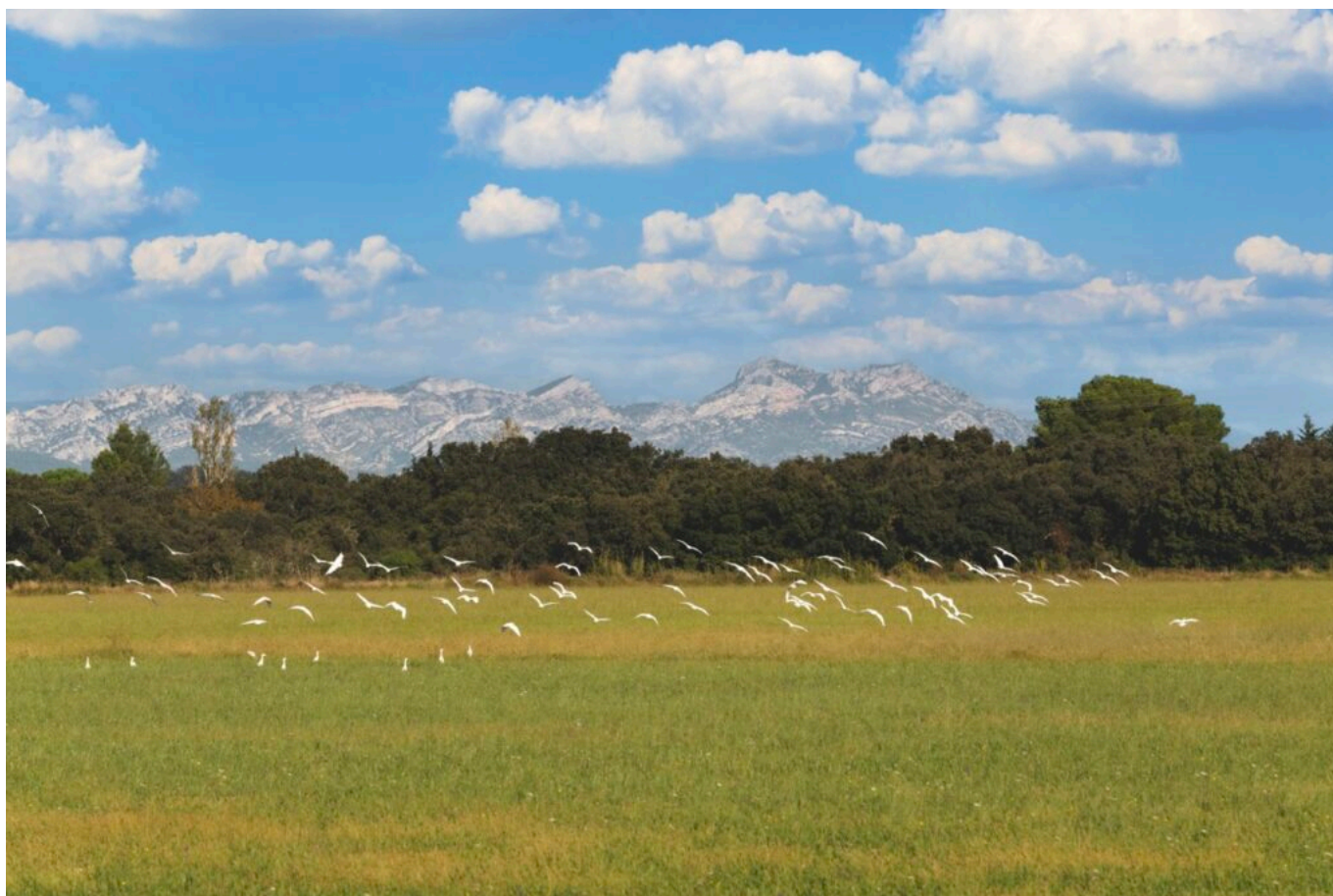
Vue des Alpilles depuis la plaine de la Crau

Ecrit par Andrée Brunetti le 23 juillet 2025