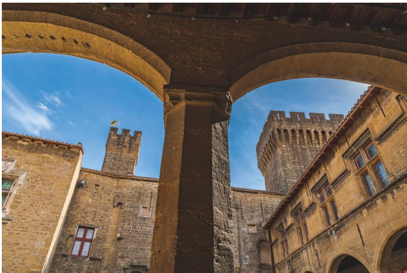
La cour d'honneur du Château de l'Empéri

Ecrit par Andrée Brunetti le 23 juillet 2025