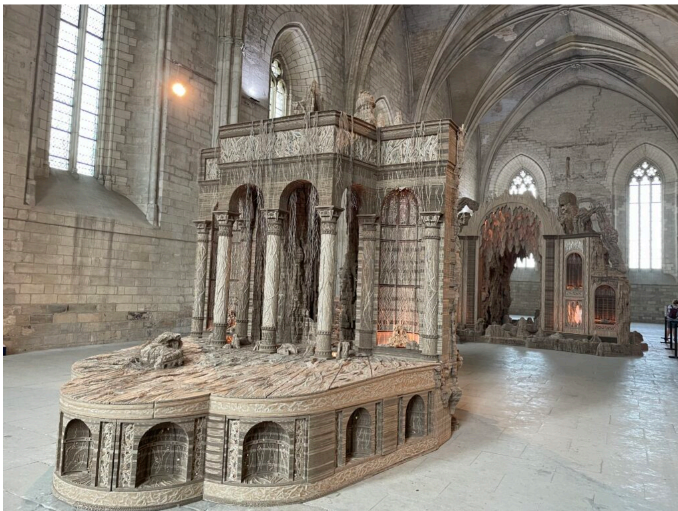
Côté Cour, Côté jardin

Ecrit par Mireille Hurlin le 1 juillet 2023