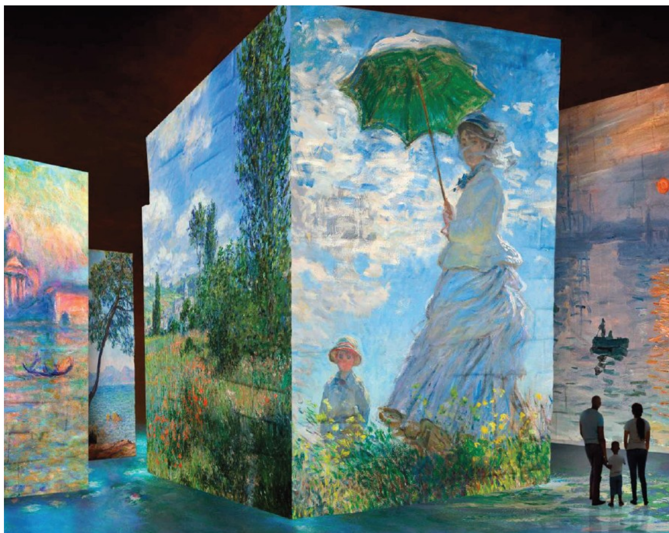
Oeuvres de Claude Monet Copyright Carrières de Lumières

Direction artistique : Nicolas Charlin / Mise en scène et animation : Cutback / Supervision musicale et mixage : Start-Rec / Production : Culturespaces Studio®