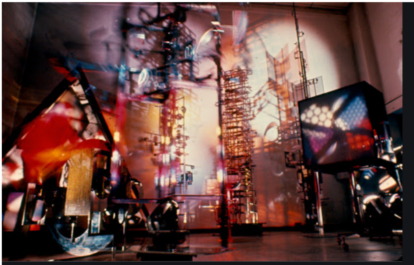
Quelques œuvres de Nicolas Schöffers

'Lumière, espace, temps' Jusqu'au 19 décembre au Grenier à sel à Avignon. Une exposition en hommage à Nicolas Schöffers et aux œuvres de 14 autres artistes.