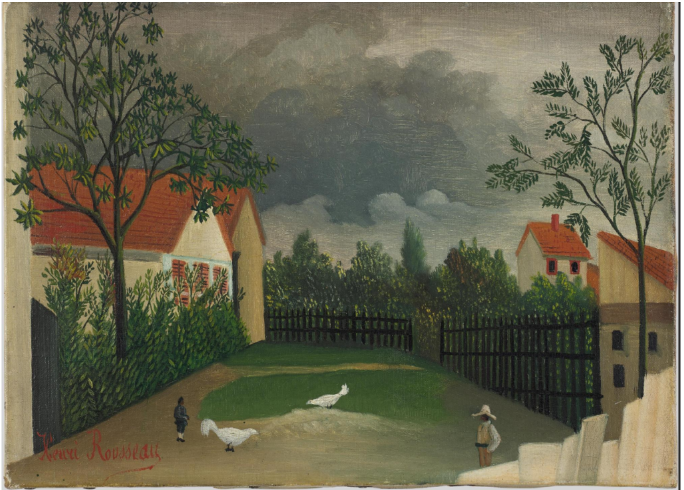
La Basse-cour (huile sur toile, 24,6 x 32,9, [1896-1898]), conservée au Musée national d'art moderne-Centre Pompidou