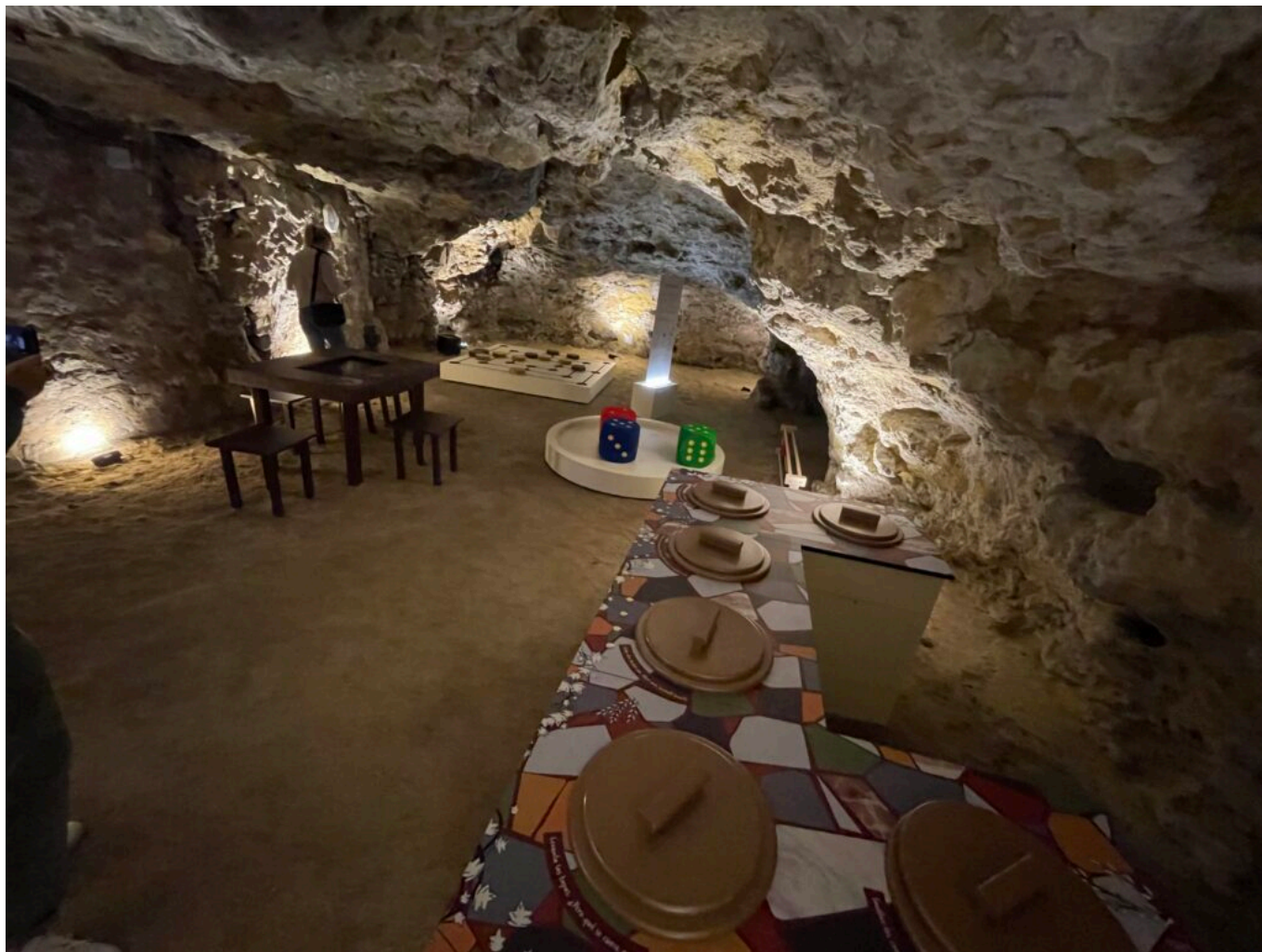
Se restaurer, jouer... en famille entre amis

La salle fait la part belle au génie romain reconnu dans le domaine, au combien essentiel, de l'hydraulique. Aménagement des territoires, approvisionnement en eau, aqueducs, thermalisme, les ingénieurs romains ont fait partie des maîtres fondateurs de l'empire. Maquette tactile et animations nous permettent d'approcher ces génies-trouve-tout : avec eux, on expérimente, on observe, on comprend l'innovation.