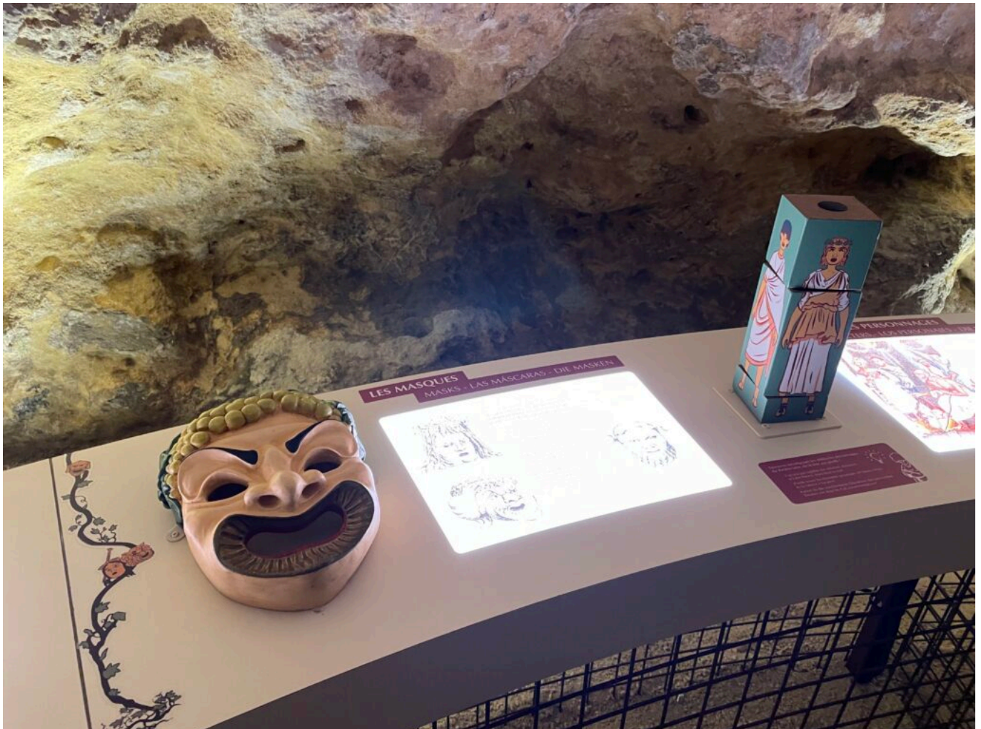
Le génie romain pour le théâtre, le plus souvent de comédies

Ecrit par Mireille Hurlin le 26 octobre 2022