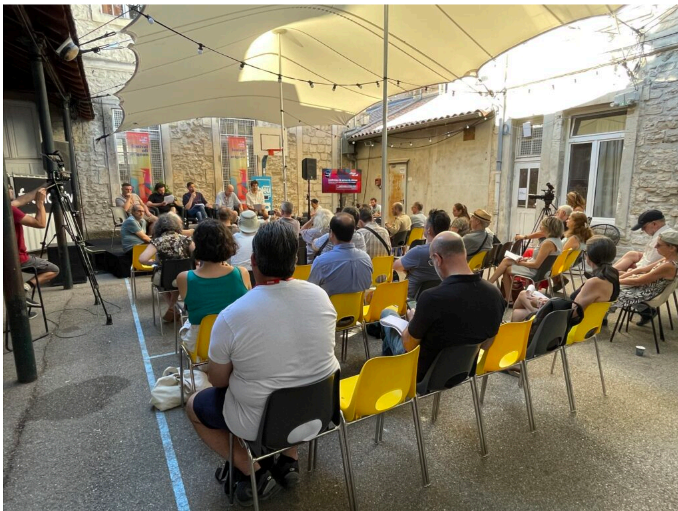
La conférence de presse au Village du off lors du pré-bilan du Festival off d'Avignon

Ecrit par Mireille Hurlin le 3 août 2022