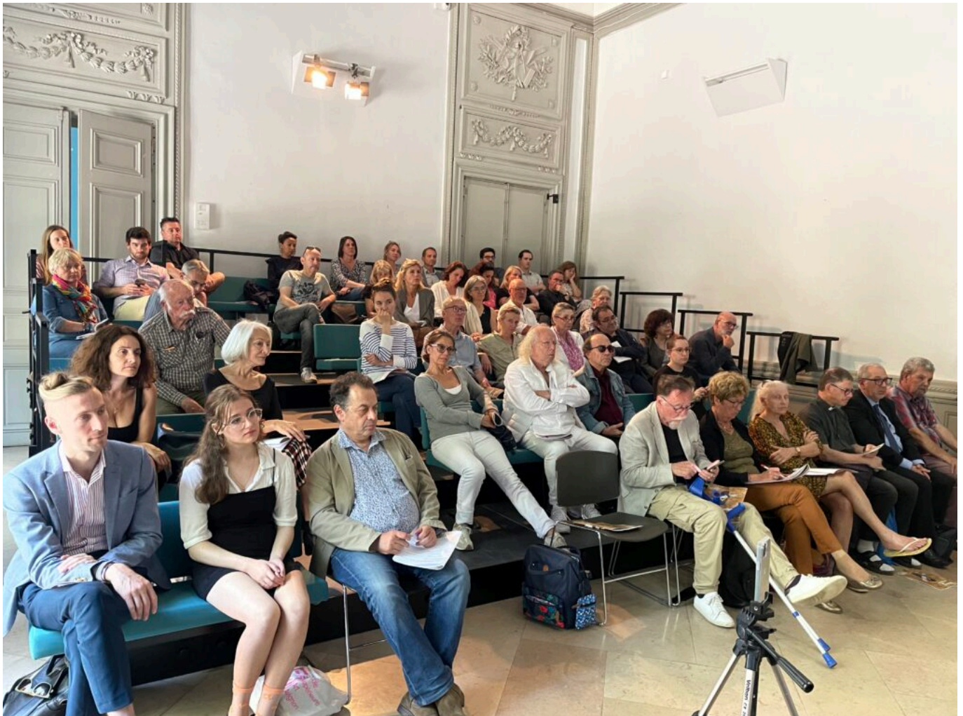
Des journalistes et, au fond de la salle Tiago Rodrigues et le directeur du Festival d'Avignon

Ecrit par Mireille Hurlin le 25 mai 2023