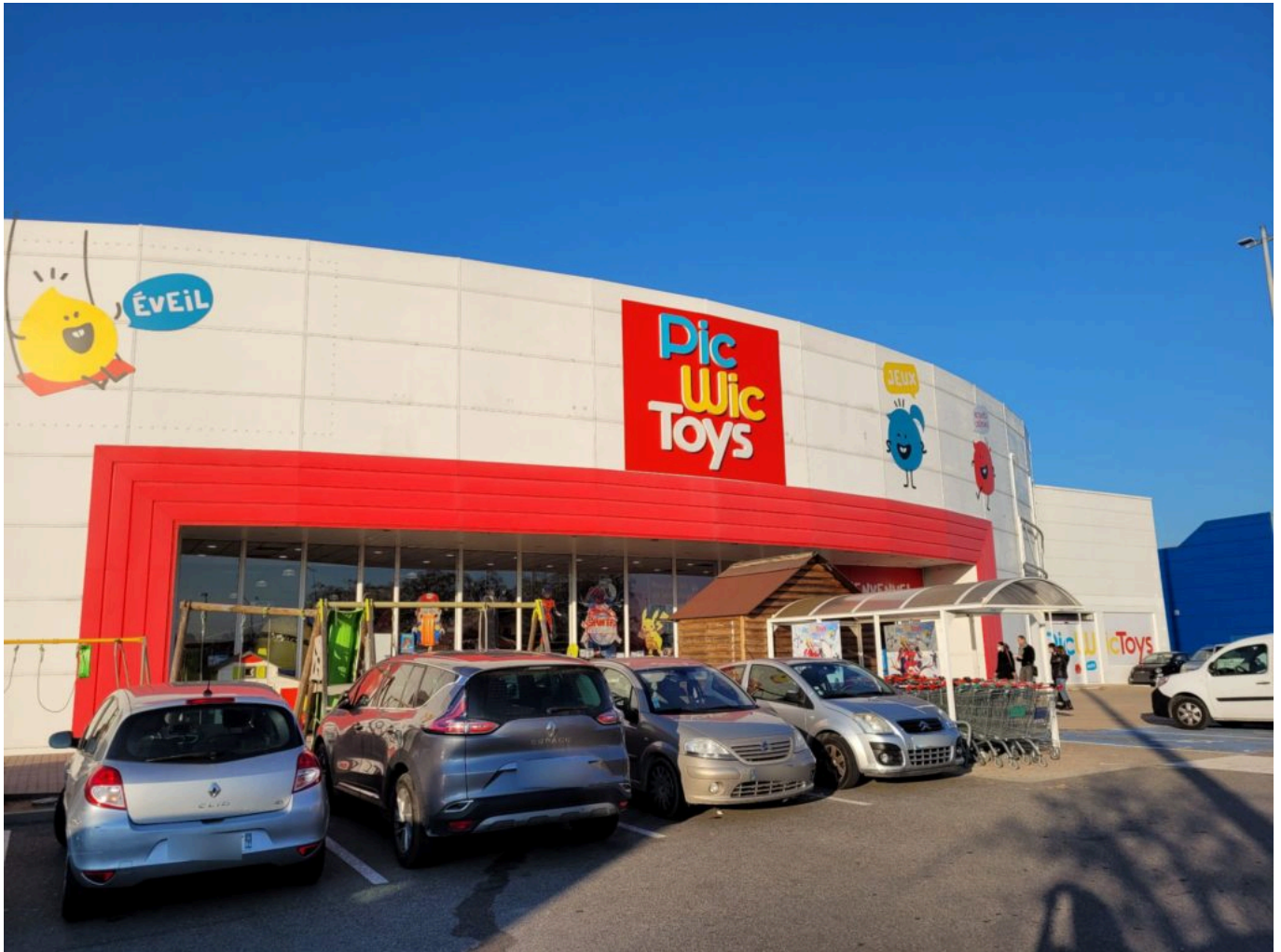
'PicWicToys' Avignon, zone commerciale Avignon Nord, Av. Jules Verne.

l'ours. Sans compter les intemporels : Barbie, figurines, jeux de société qui ont ressurgi dans le sillage des confinements. Mattel, Vtech, Hasbro, ils forment les fournisseurs historiques de l'enseigne qui propose également des jouets sous sa propre marque, présents dans tous les univers.