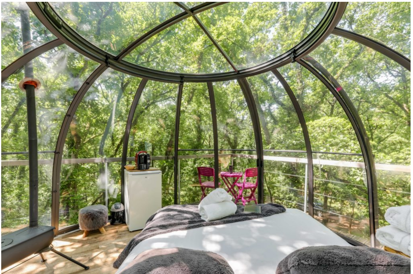
Lit bulle perchée ©Abracadaroom

« De manière générale, il y a un énorme potentiel de développement d'hébergements insolites, qui se heurte quelques fois aux contraintes. Je pense à la réglementation relative à la protection des parcs naturels régionaux, qui rend les démarches plus compliquées », souligne-t-il. Les villes plébiscitées ? « Les milieux ruraux, tout ce qui se situe à 3h des grandes villes fonctionne très bien. Si vous tenez à avoir quelques exemples, la Bretagne et l'Aquitaine recensent beaucoup d'hébergements. Mais il en existe absolument partout en France, même si dans le Vaucluse, on n'en compte un peu moins. Il y en a dans la Drôme également. »