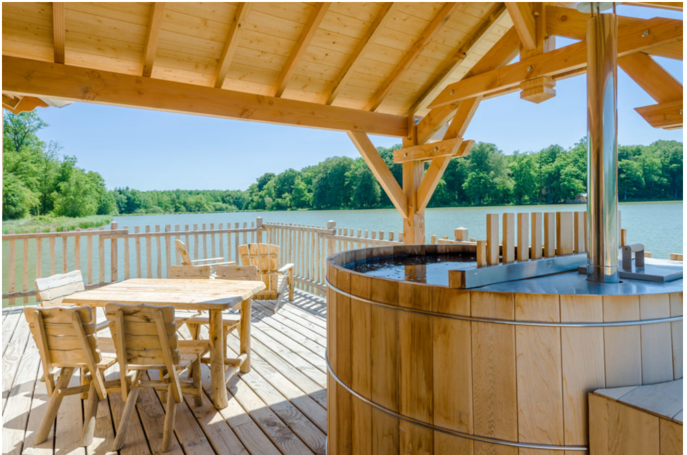
Spa cabane flottante

Ecrit par Linda Mansouri le 17 juillet 2021