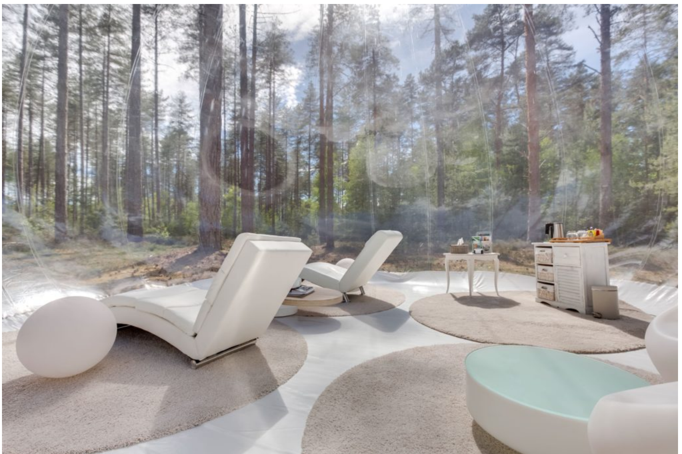
Bulle de cristal