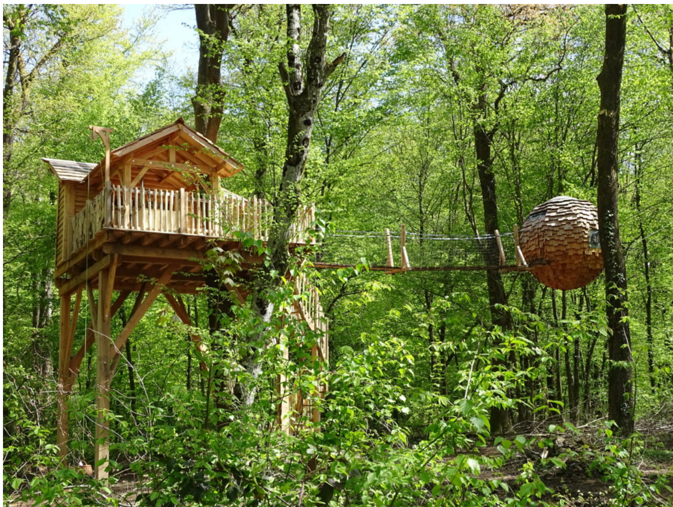
Cabane grands chênes

se lancer dans le vide au bout d'une tyrolienne, ou se laisser flotter au milieu d'un lac. On peut observer les étoiles depuis son lit dans une bulle ou une pyramide de verre. On peut vivre comme un indien le temps d'un séjour dans un tipi, braver le froid dans un igloo, se prendre pour un trappeur dans une cabane en rondins ou encore partir sur les traces de l'anneau dans un trou de Hobbit.