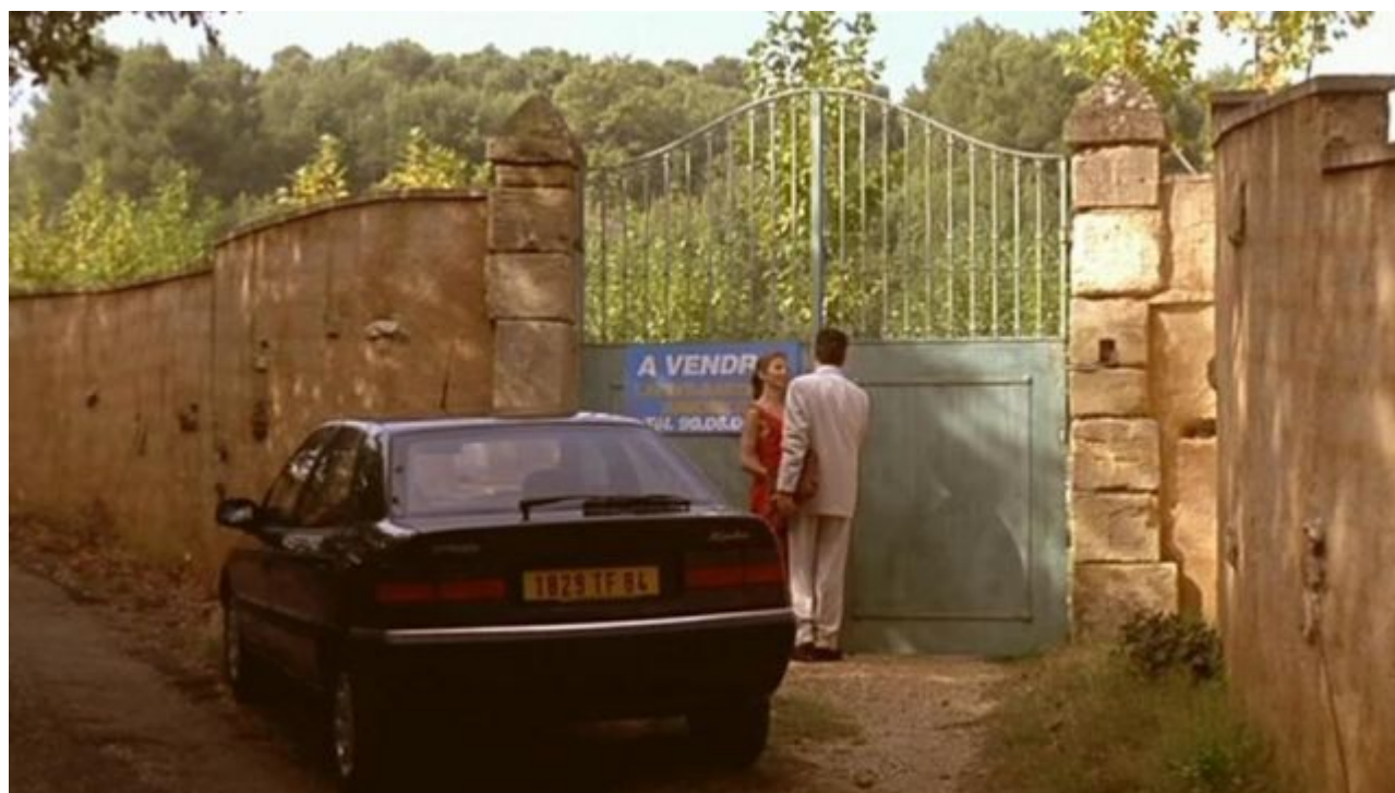
Le village d'Oppède-le-Vieux dans 'Gazon Maudit' avec Alain Chabat (1995)

« Nous devons intégrer le savoir américain tout en l'adaptant à la réalité du modèle français. D'où l'intérêt de fabriquer des programmes d'enseignement commun et de les étendre via les campus physiques ou numériques. Les enseignants et les personnes issues du métier sont légion dans le Vaucluse ou les départements limitrophes. »