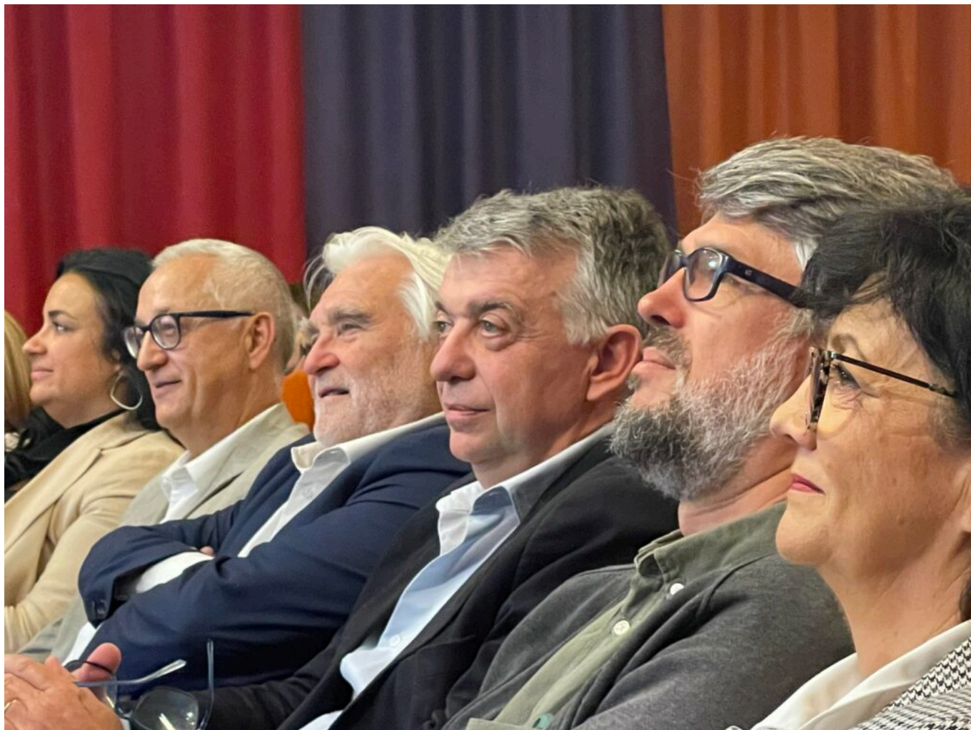
Zan, un casse-tête chinois pour les élus

Ecrit par Mireille Hurlin le 24 octobre 2022