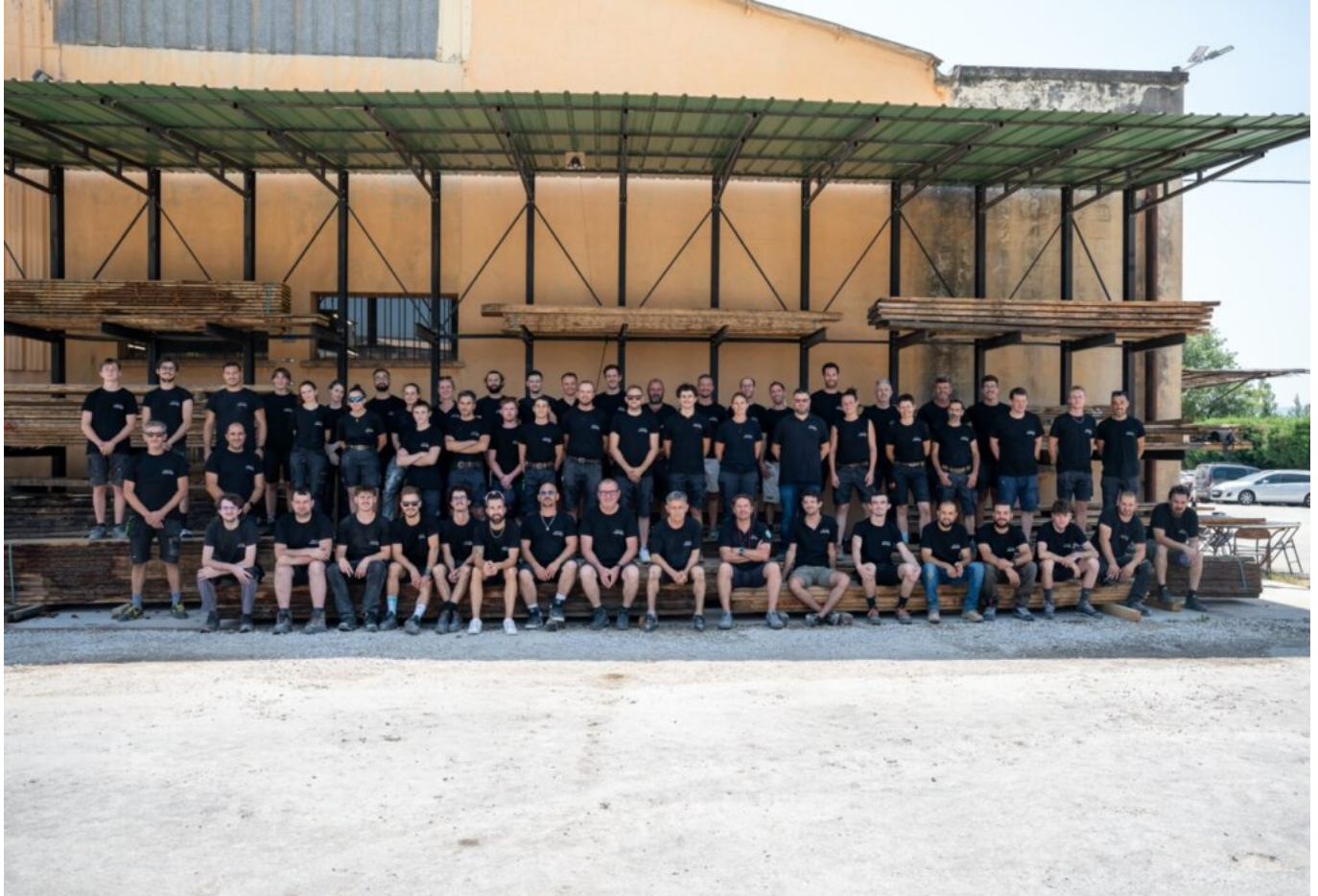
L'équipe de Gargas.