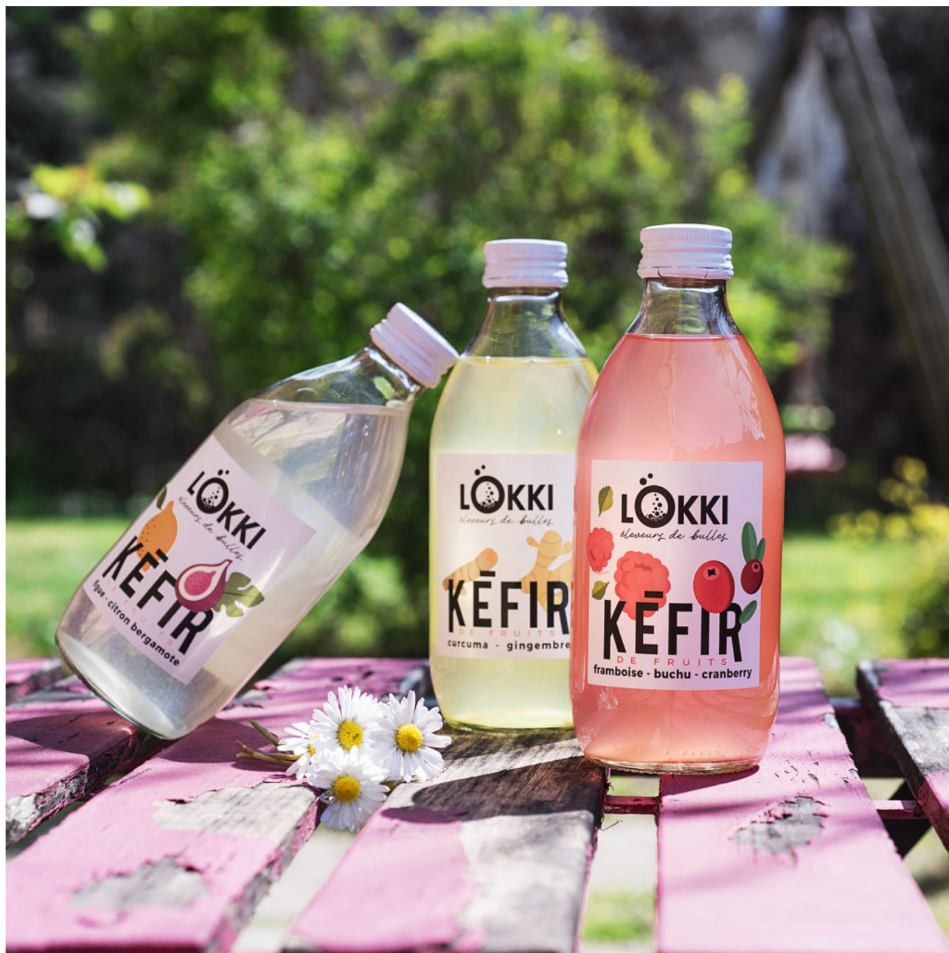
Trois teintes de kéfirs.

Ecrit par Linda Mansouri le 21 septembre 2021