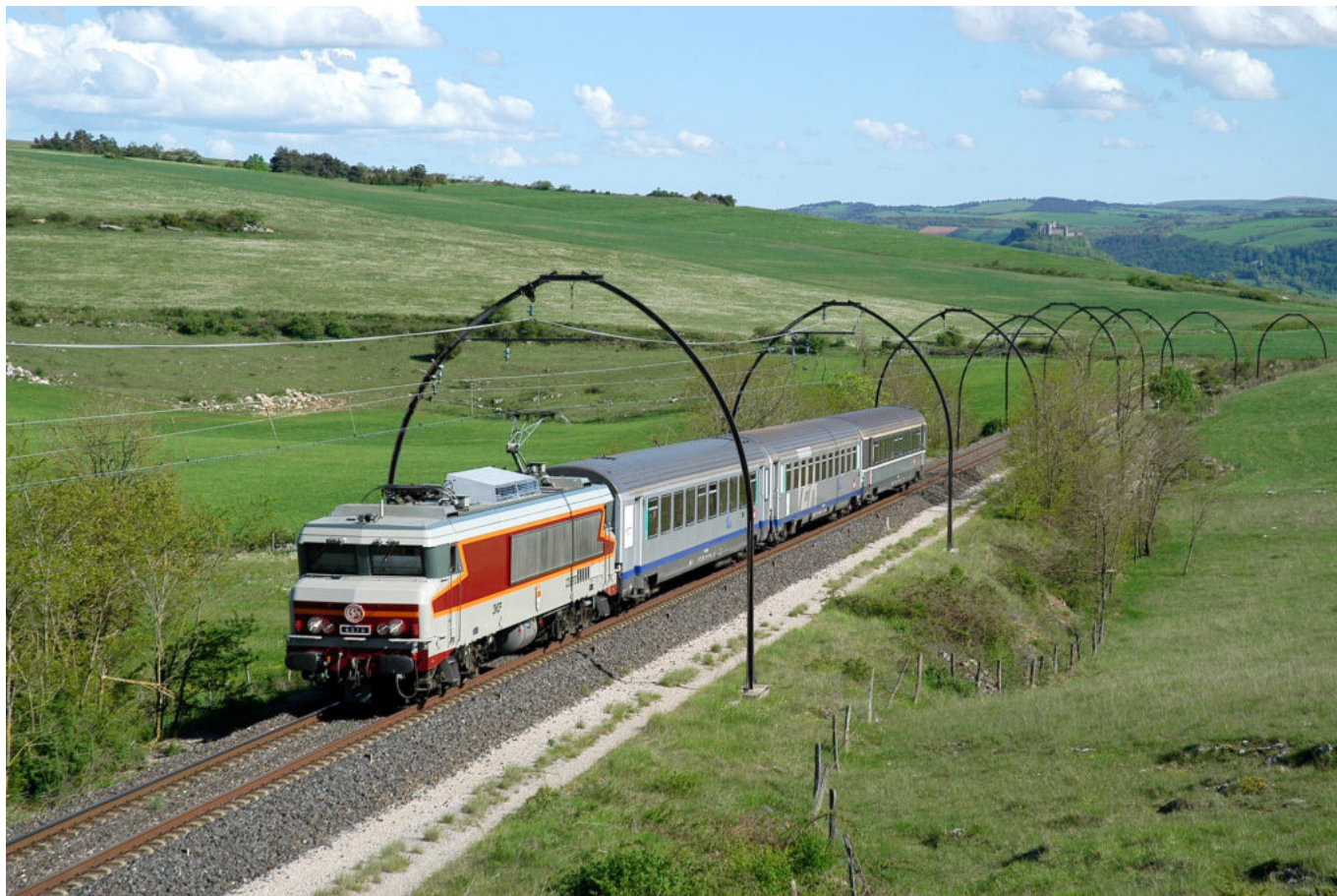
la CC6570

Ecrit par Mireille Hurlin le 8 décembre 2020