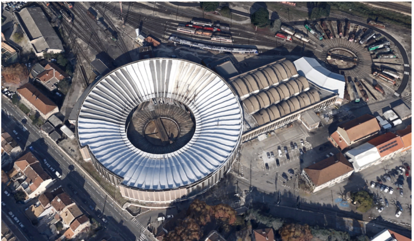
La Rotonde, Avignon.

Sources : Rédacteur : Jean-Lucien Bonillo, Ensa Marseille, 2002, d'après les travaux de Nicolas Nogue. '20 monuments du XXème siècle', exposition patrimoine moderne en région Provence-Alpes-Côte d'Azur, eaml, 2002.