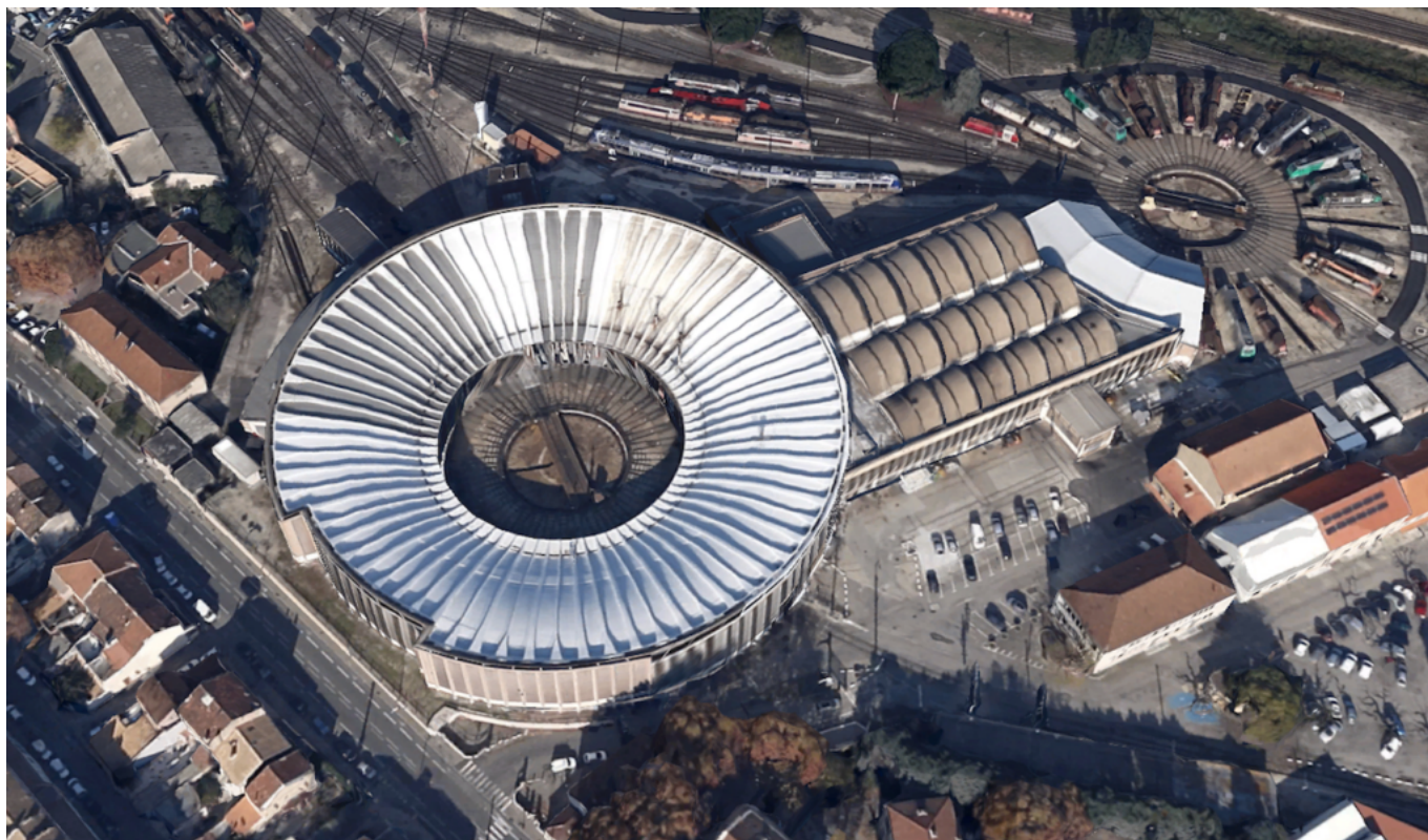
La Rotonde, Avignon.

Sources : Rédacteur : Jean-Lucien Bonillo, Ensa Marseille, 2002, d'après les travaux de Nicolas Nogue. '20 monuments du XXème siècle', exposition patrimoine moderne en région Provence-Alpes-Côte d'Azur, eaml, 2002.