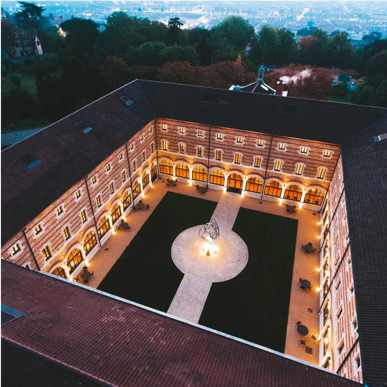
Le 'Fourvière hôtel' réalisé en 2015 dans un ancien couvent du XIXe siècle.

La philosophie du groupe ? Des emplacements exceptionnels, la valorisation d'un patrimoine architectural et une hôtellerie à thème.