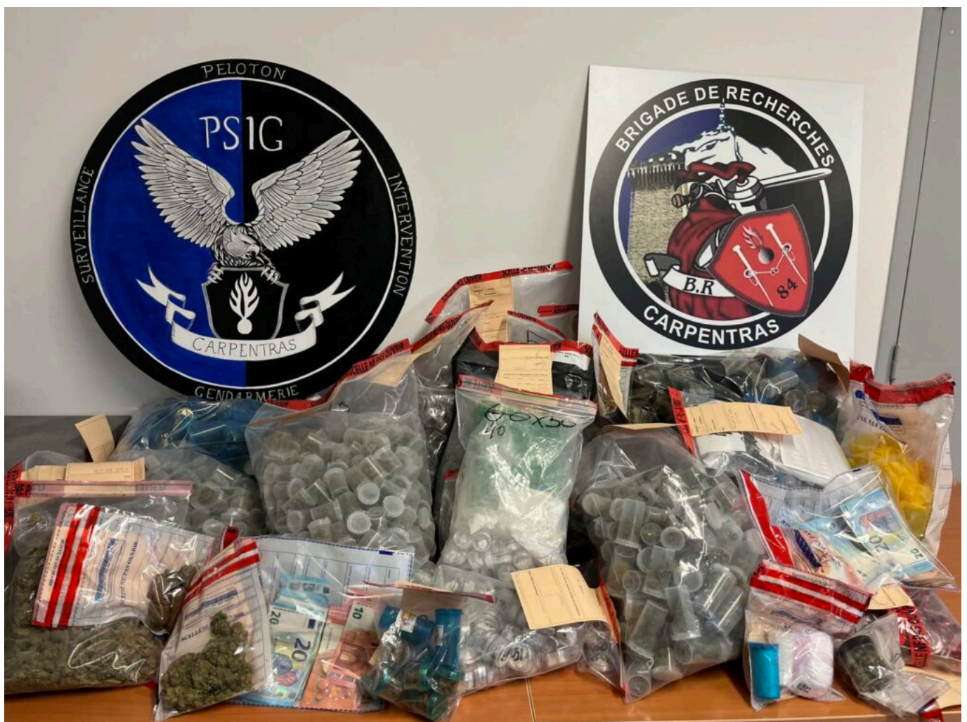
Saisie record en Vaucluse en 2023 pour les gendarmes, les douaniers et les policiers.

Par ailleurs en 2023 ce sont 5,625M€ (+92 %) d'avoirs criminels qui ont été saisis par la DIPN (Direction interdépartementale de la police nationale - anciennement DDSP) et plus de 5,46M€ par la gendarmerie (+91%). Au cours de l'année, 240 armes à feu ont été aussi saisies par la gendarmerie (+83%) et 90 par la DIPN (+34,3%). Des saisies d'armes (où figure une trentaine d'arme de guerres de type 'kalachnikov' ou 'Uzi') souvent en lien avec les trafics de stupéfiants, mais également dans d'autres cadres tels que les interventions pour violences intra-familiales.