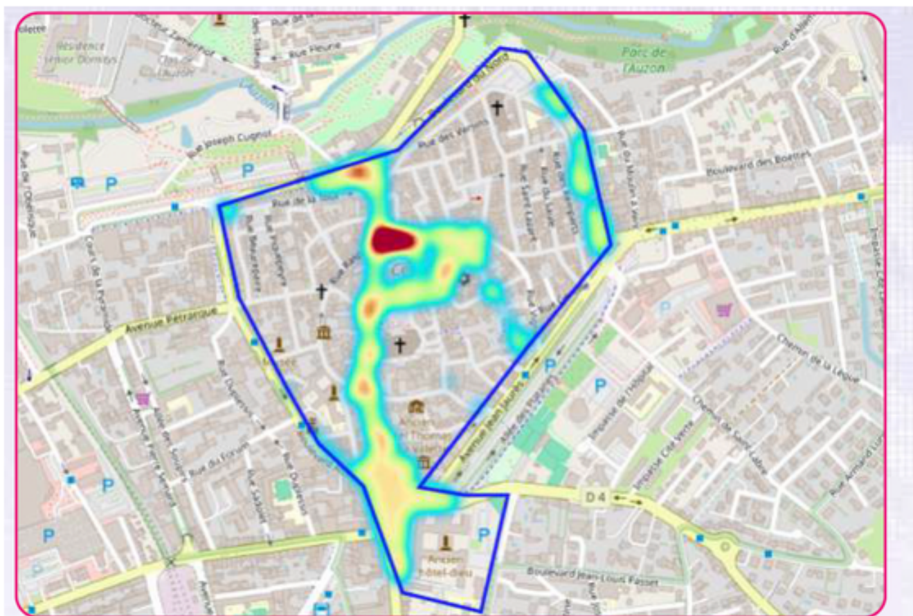
Carte de chaleur du centre ville de Carpentras sur la période du festival

Ecrit par Mireille Hurlin le 2 mars 2026