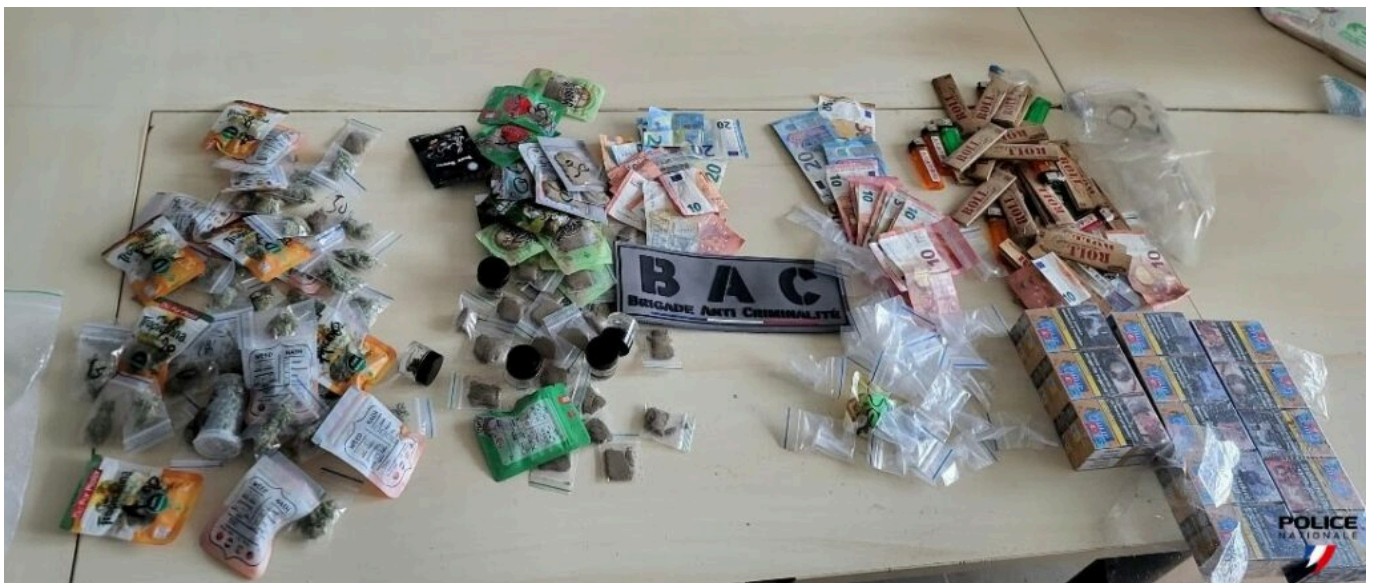
Saisie de stupéfiants par la Bac d'Avignon le 30 janvier dernier.

« On met en place plusieurs façons de s'attaquer à ces trafics, poursuit la procureure. Evidemment, l'interpellation, la répression et la condamnation mais également la saisie des avoirs financiers. Car si la case détention est quelque chose qui est parfaitement intégré par les délinquants, nous faisons le constat que la saisie des avoirs est un axe particulièrement efficace dans la lutte contre ces trafics. Que ce soit au niveau des produits mais aussi des biens et des immeubles. Aujourd'hui, la question n'est plus de se demander si l'on peut saisir les biens des narcotrafiquants mais comment nous allons les saisir. »