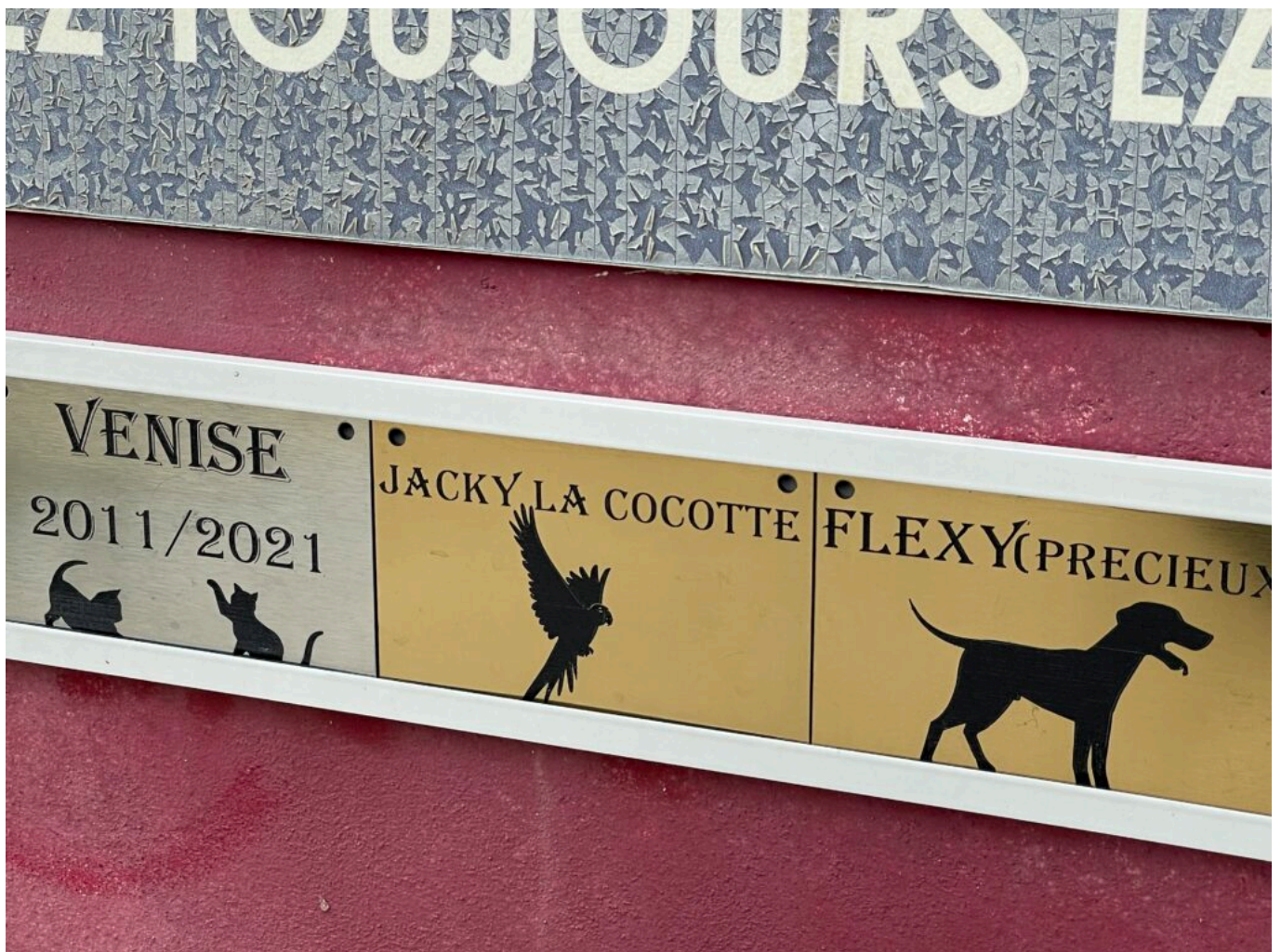
Le mur du souvenir