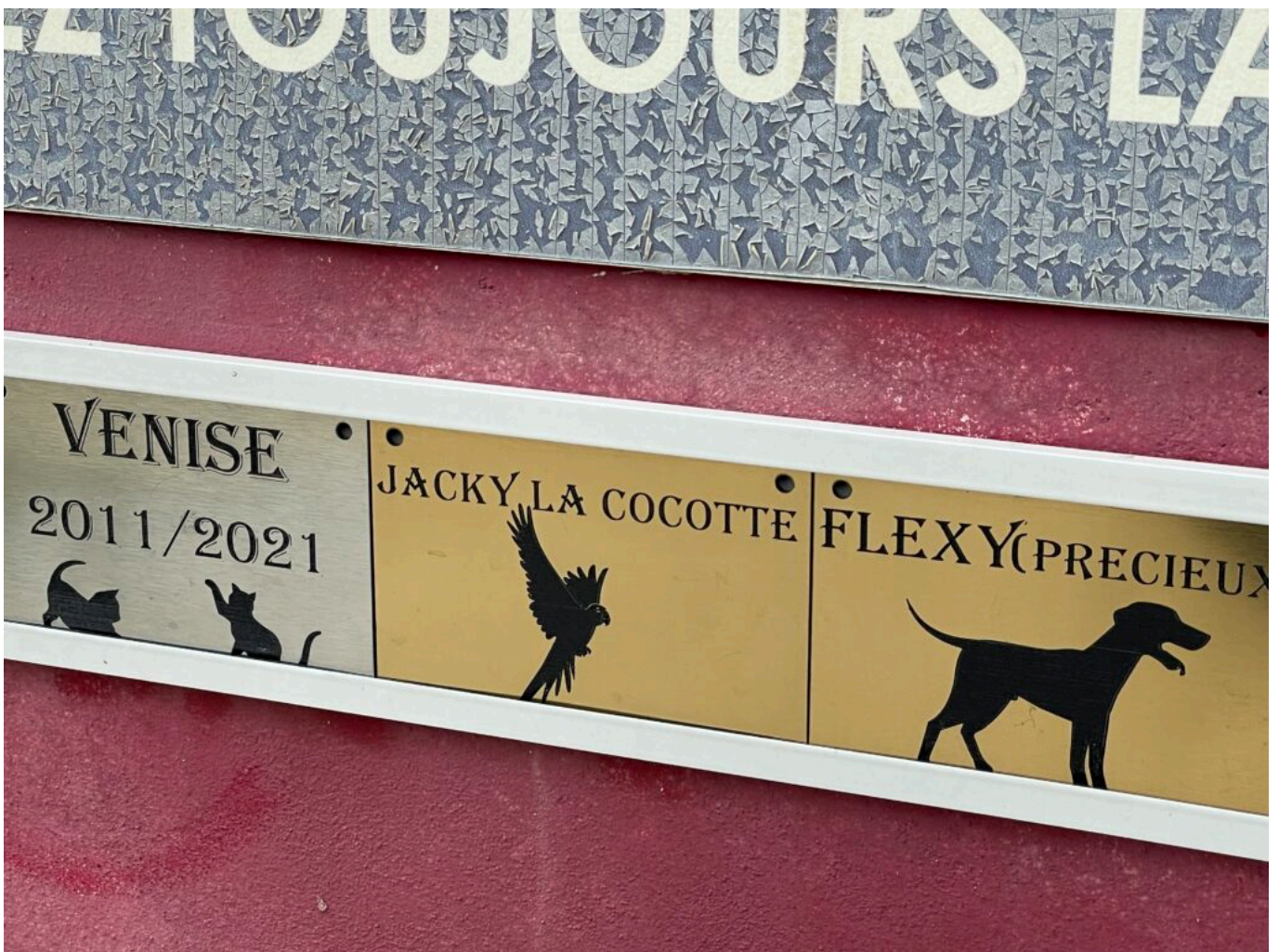
Le mur du souvenir