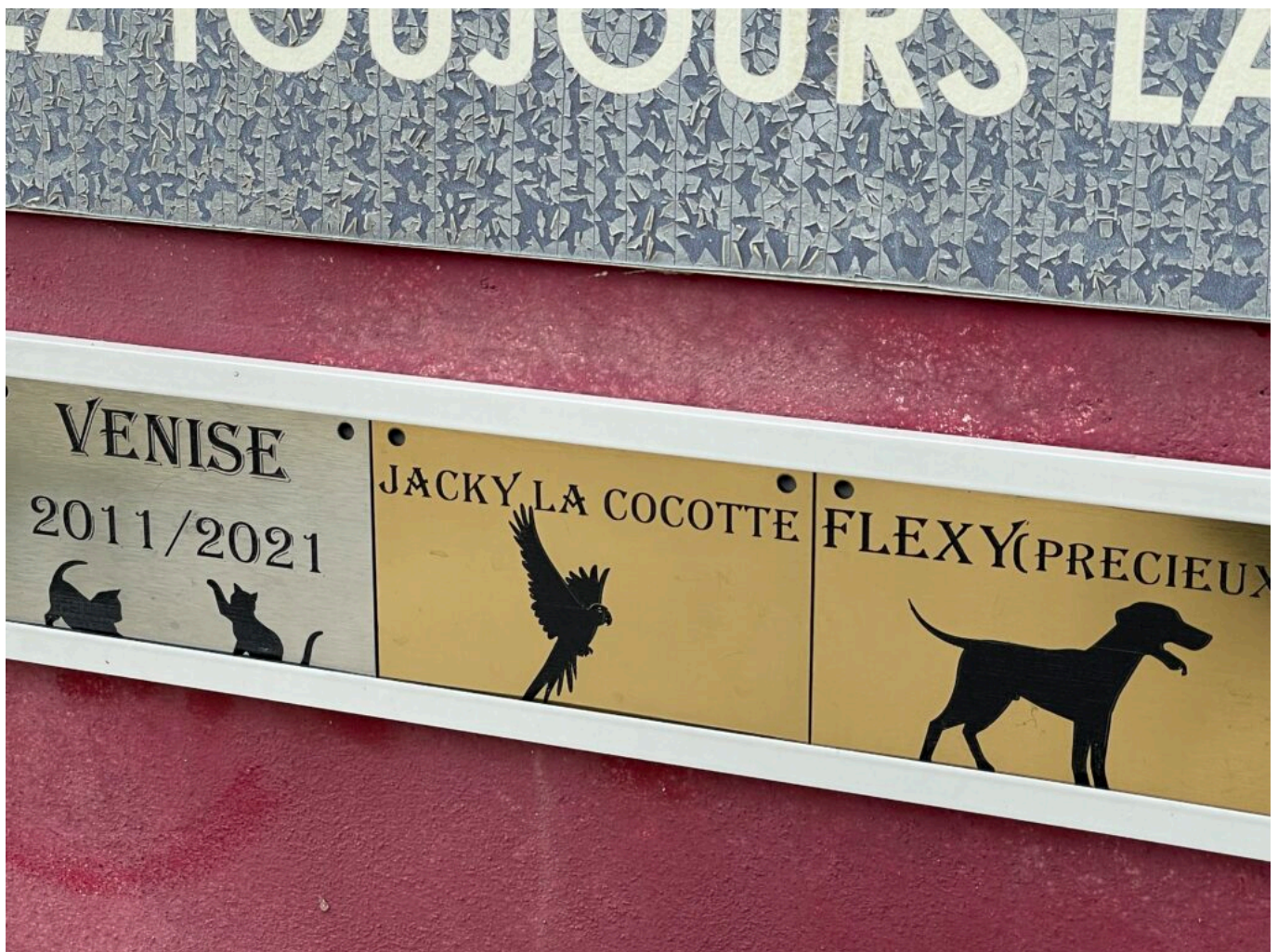
Le mur du souvenir