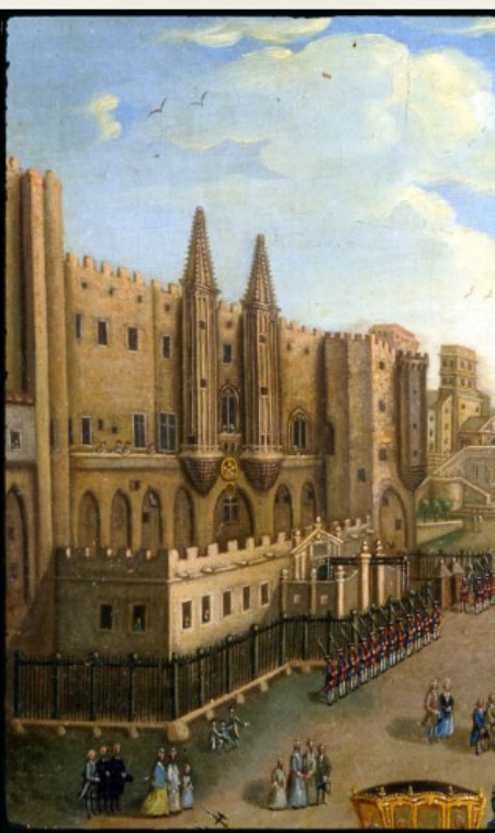
GORDOT - Entrée au Palais des Papes