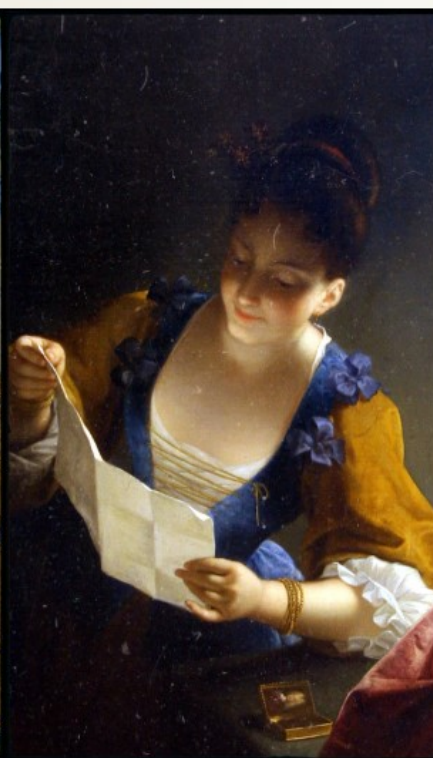
RAOUX J - Liseuse

La fondation Calvet a lancé son nouveau site Internet où elle déroule tous ses trésors. Il y a tout d'abord le Musée Calvet , puis le musée Lapidaire , les bibliothèques de la fondation Calvet, le muséum Requien , la bibliothèque Requien , le Musée du Petit Palais , le Médaillier Calvet , voilà pour Avignon et, enfin, le musée archéologique de l'Hôtel Dieu et le musée Jouve et juif Comtadin à Cavaillon.