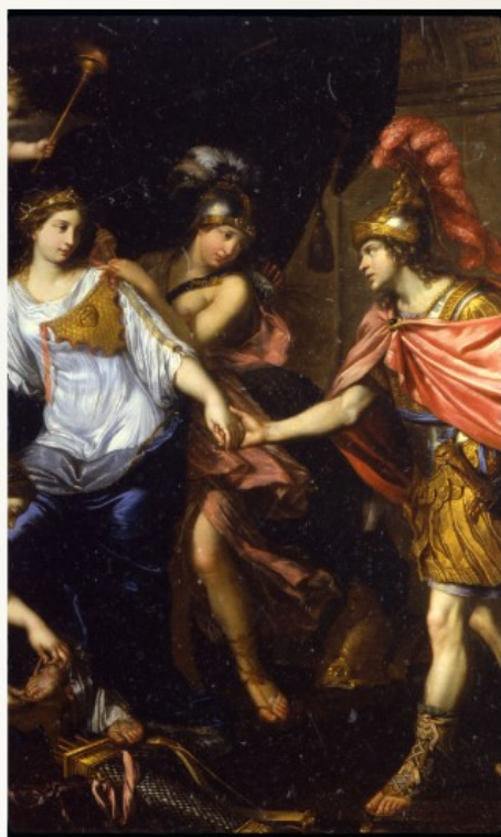
MIGNARD P- La rencontre d'Alexandre avec la reine des Amazones