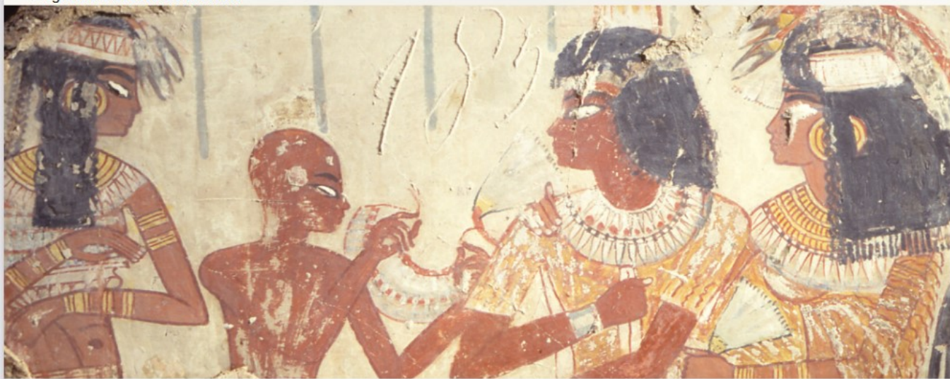
Fragment d'une tombe thébaine

«Son cabinet de curiosités et sa bibliothèque seront le fondement de sa donation pour la création du Musée Calvet, qui devait permettre au public d'accéder aux Lumières, indique la Fondation Calvet. Dans son testament de 1810, il organise cet accès à la connaissance en y joignant ses biens immobiliers pour en assurer la gestion future et en instituant trois exécuteurs testamentaires - nommés à vie- et de 5 administrateurs nommés pour 10 ans, par le Conseil municipal d'Avignon et chargés de faire respecter ses volontés jusqu'à maintenant.»