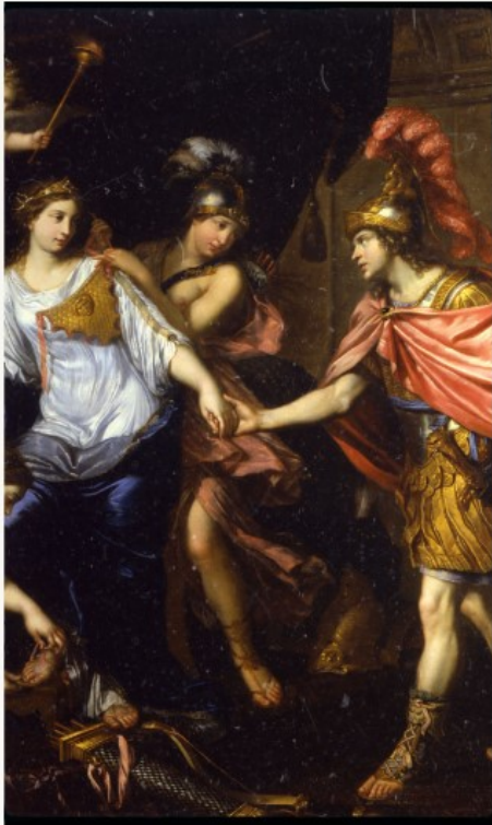
MIGNARD P- La rencontre d'Alexandre avec la reine des Amazones