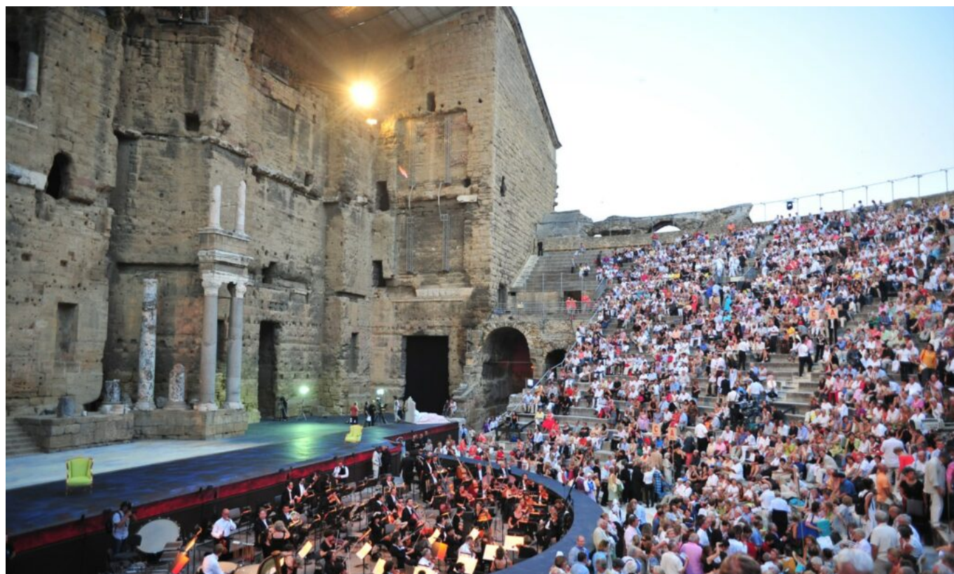
Les spectateurs de la Traviata en 2019.

Parmi les constats de la CRC : « Une fréquentation atone et sans aucune mesure avec la capacité d'accueil du Théâtre Antique, une absence de projet stratégique partagé, une surestimation chronique et systématique des recettes, des procédures de passation des marchés entachées d'importantes irrégularités puis aucune dépense n'a fait l'objet d'une procédure de marché public ».