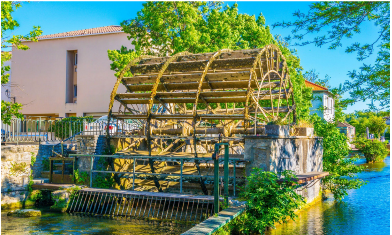
Les roues à aubes de l'Isle-sur-la-Sorgue