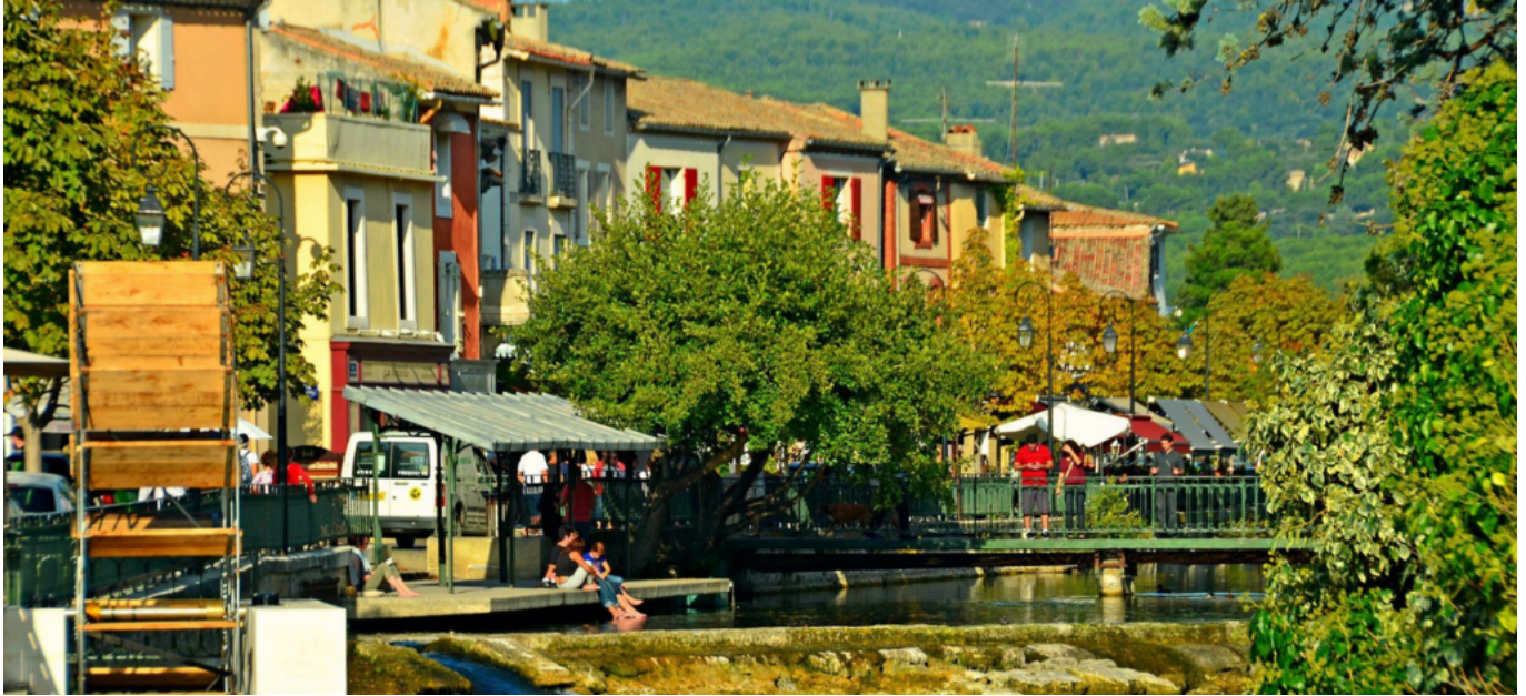
DR La Venise Comtadine