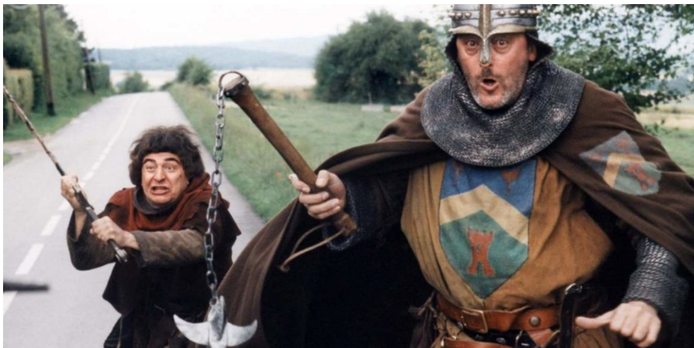
Christian Clavier et Jean Reno, 'Les visiteurs'.