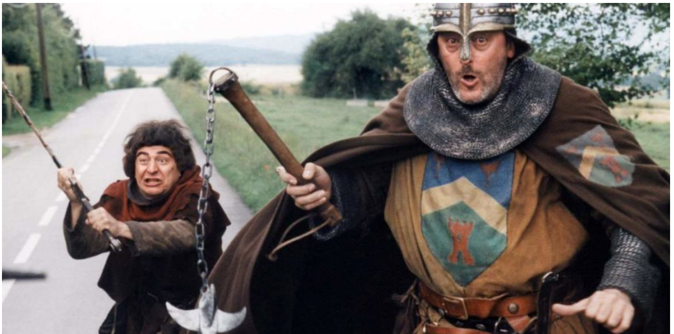
Christian Clavier et Jean Reno, 'Les visiteurs'.