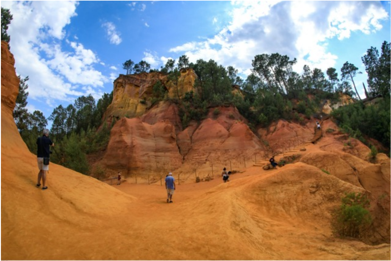
Le Sentier des ocres

Ecrit par Vanessa Arnal-Laugier le 24 avril 2025