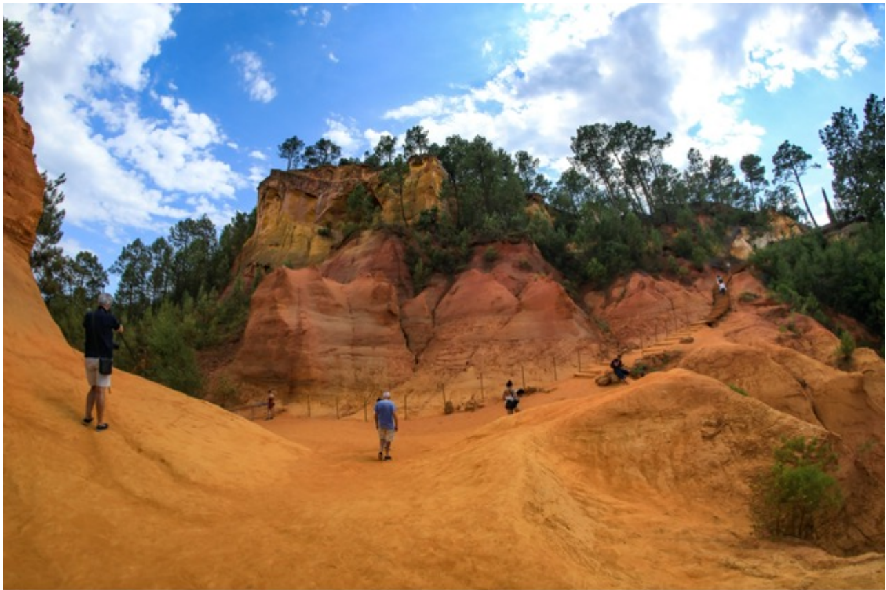
Le Sentier des ocres

Ecrit par Vanessa Arnal-Laugier le 24 avril 2025