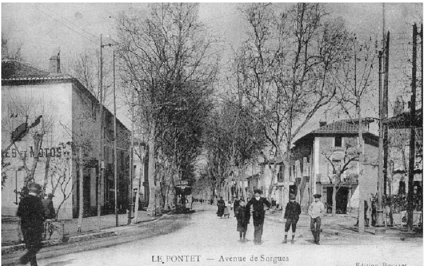
Le Pontet s'est émancipé d'Avignon en 1925.

« Sur le patrimoine des pauvres, le Bureau de Bienfaisance allouera au Pontet une somme de 1 500 à 2 000 francs, représentant le vingtième des revenus annuels des pauvres, peut-on aussi lire dans les articles de presse de l'époque. Dans ce chiffre, bien entendu, n'est pas compris le rendement de la taxe sur les spectacles, sur lequel la nouvelle commune perd tous ses droits. Le droit au lit de l'hôpital d'Avignon et les charges correspondantes seront également réparties selon la population. La nouvelle commune ne fonctionnera pas avant les élections municipales du 3 mai 1925. »