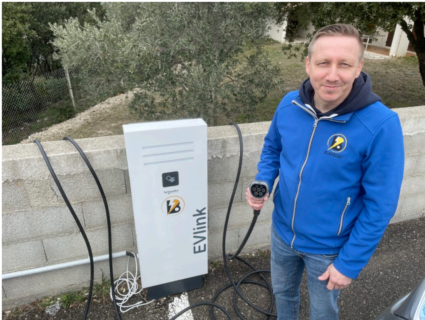
Autre système de borne de recharge

Ecrit par Mireille Hurlin le 27 mars 2023