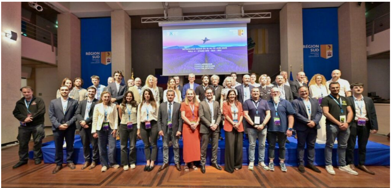
L'ensemble de la délégation des 36 exposants régionaux ayant pris possession du pavillon de la Région SUD.