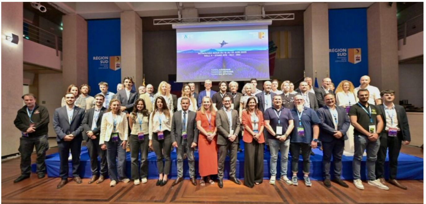
L'ensemble de la délégation des 36 exposants régionaux ayant pris possession du pavillon de la Région SUD.