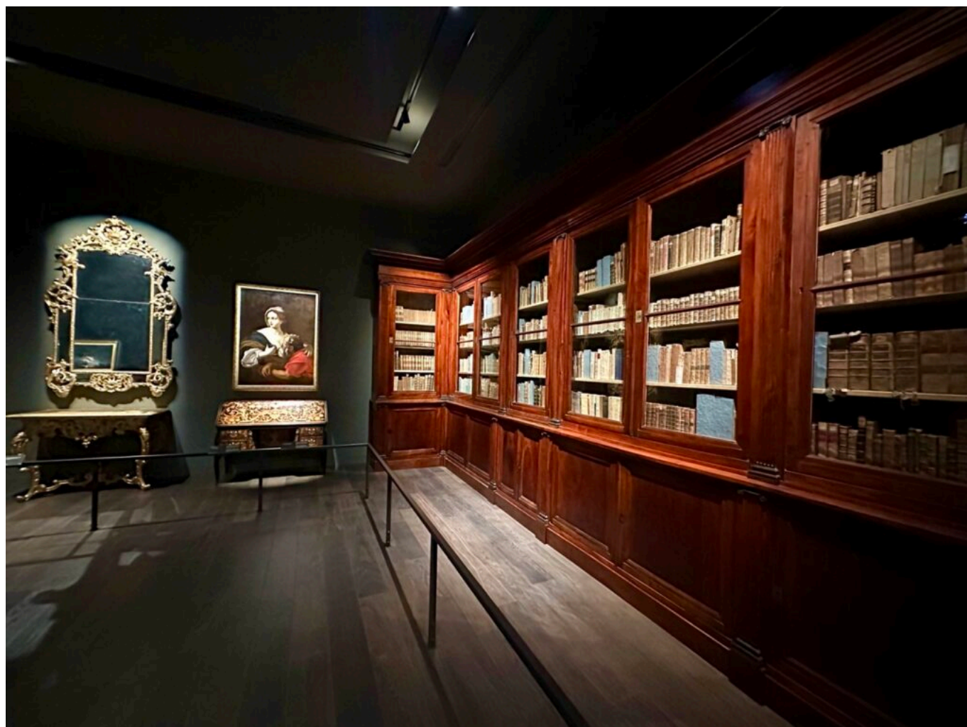
La bibliothèque de Barjavel

Ecrit par Vanessa Arnal-Laugier le 19 avril 2024