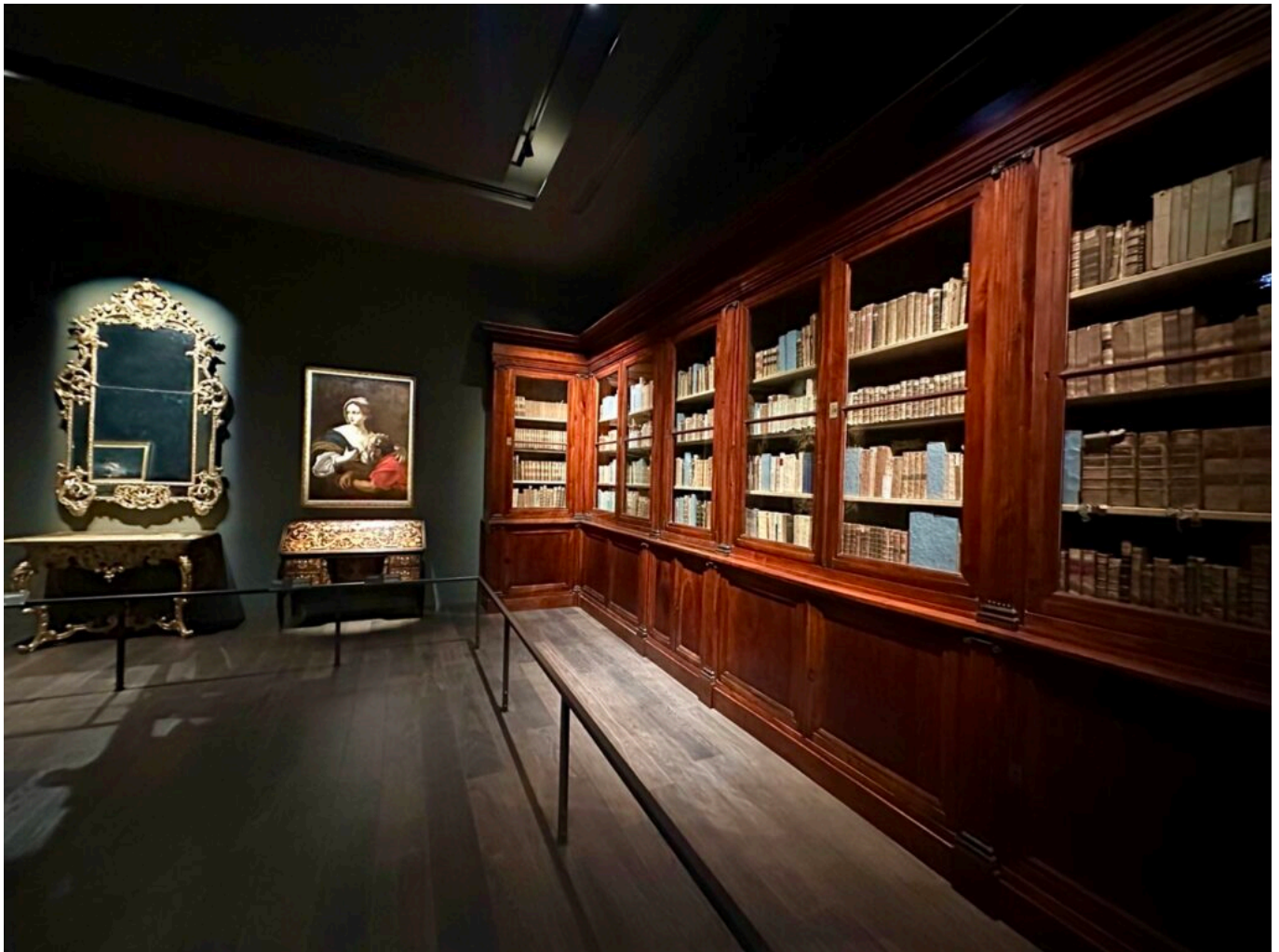
La bibliothèque de Barjavel