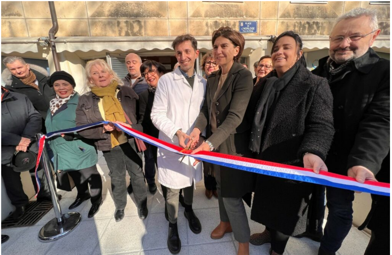
Inauguration de la maison de santé à Avignon en février dernier.