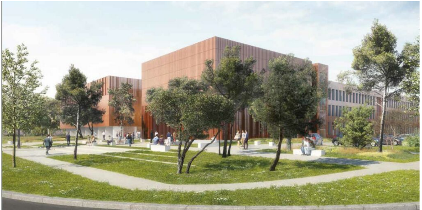
Memento à Agroparc.

Ecrit par Laurent Garcia le 25 septembre 2023