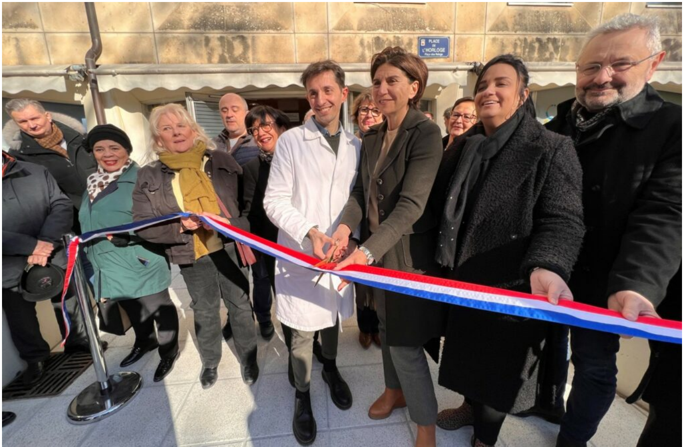
Inauguration de la maison de santé à Avignon en février dernier.

Ecrit par Laurent Garcia le 25 septembre 2023