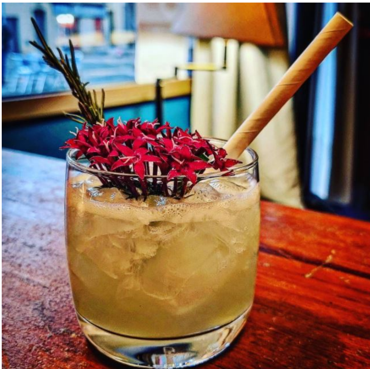
Les cocktails vous attendent 2 place des Carmes à Avignon.

Ecrit par Linda Mansouri le 20 février 2022