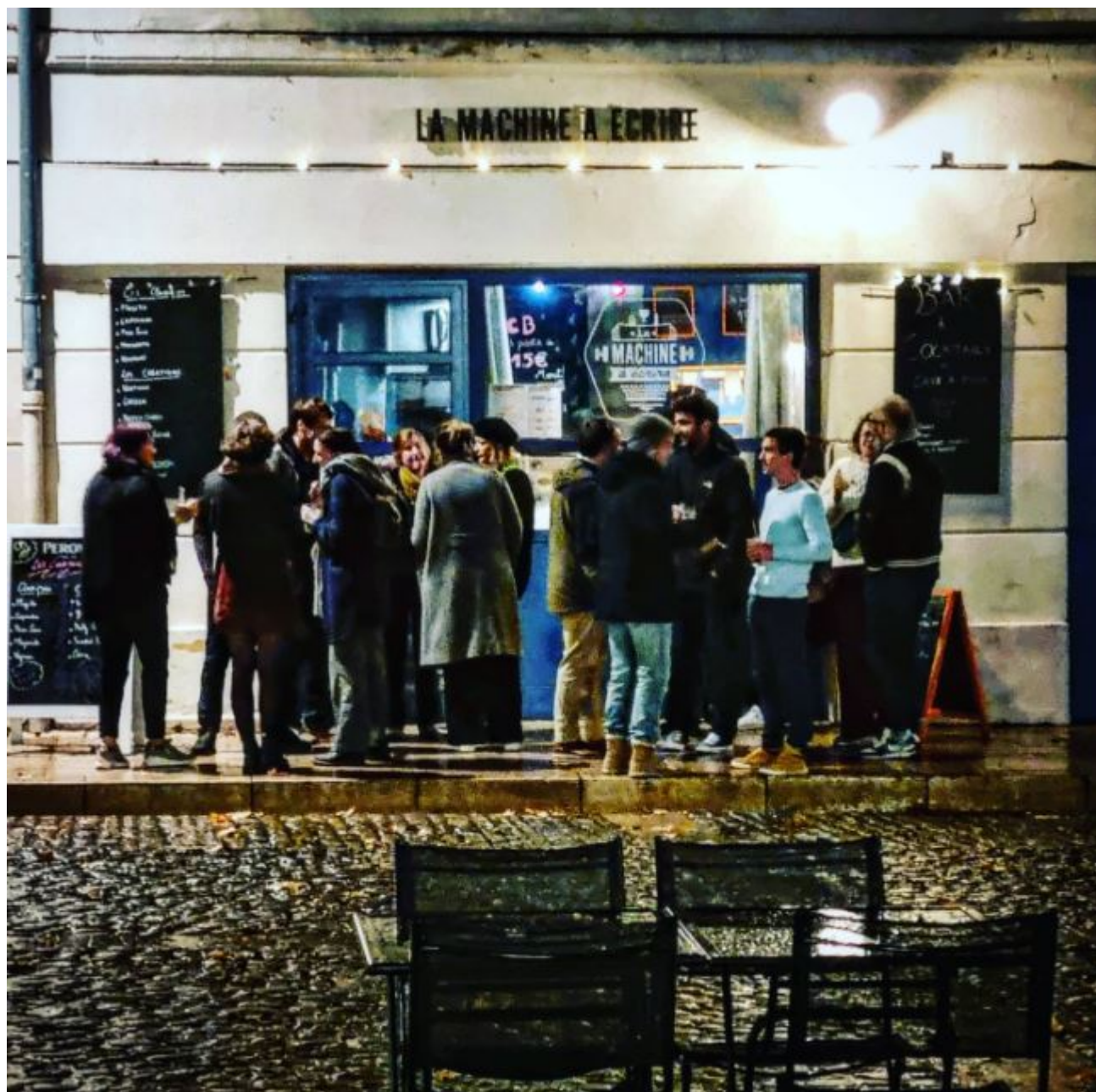
Carton plein à la Machine à écrire.