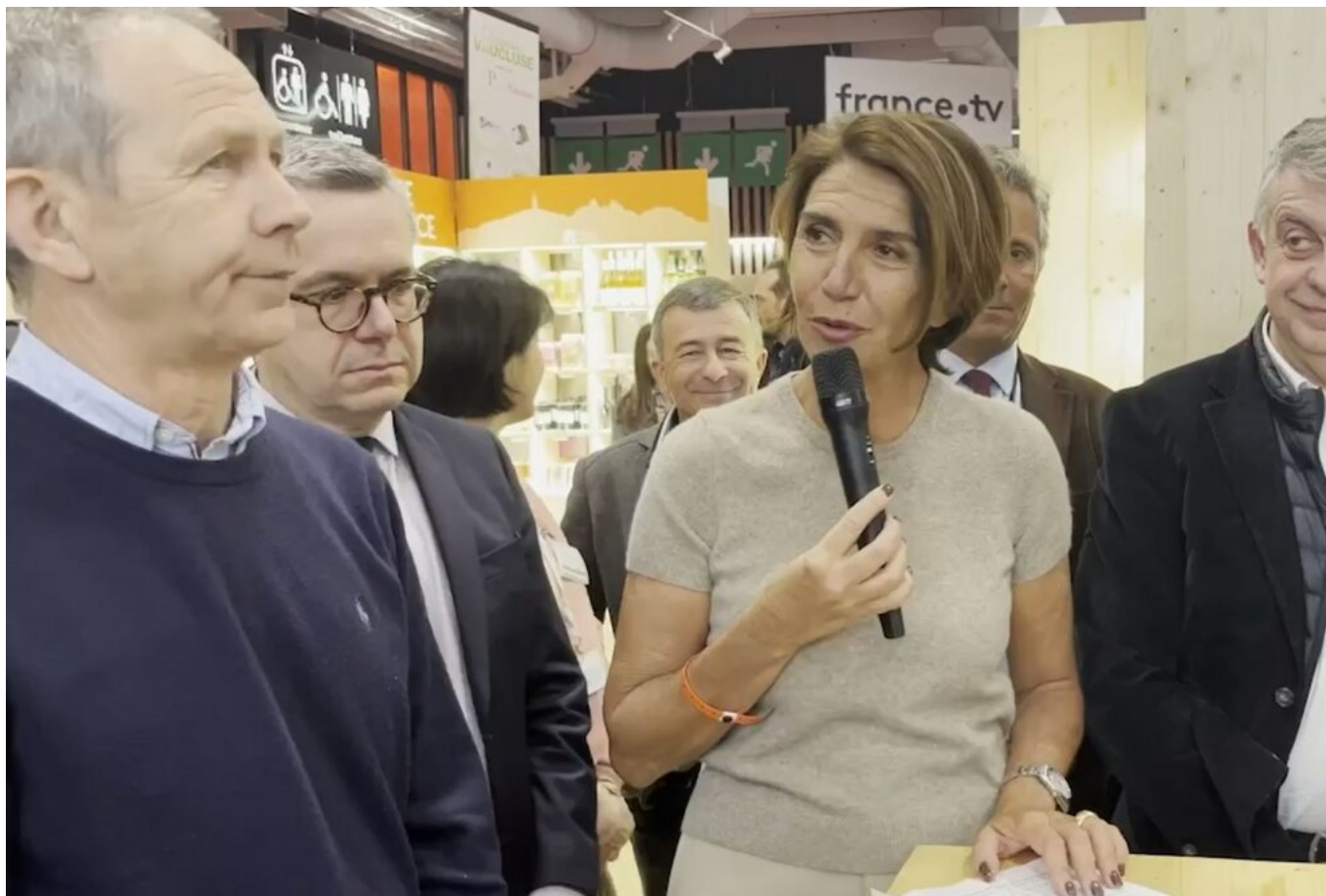
La présidente du Conseil départemental de Vaucluse.