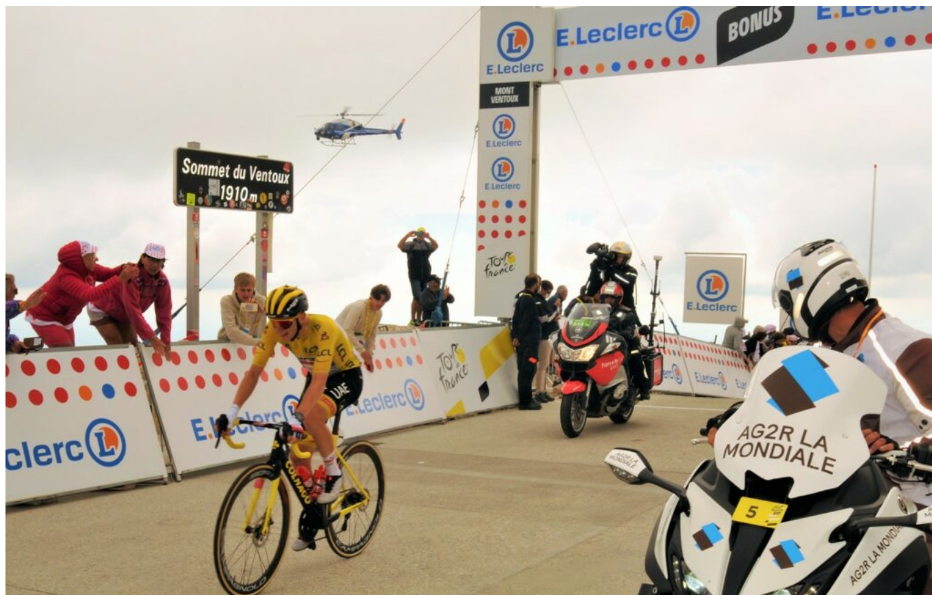
Tadej Pogačar, le maillot jaune, au sommet du Ventoux en 2021.