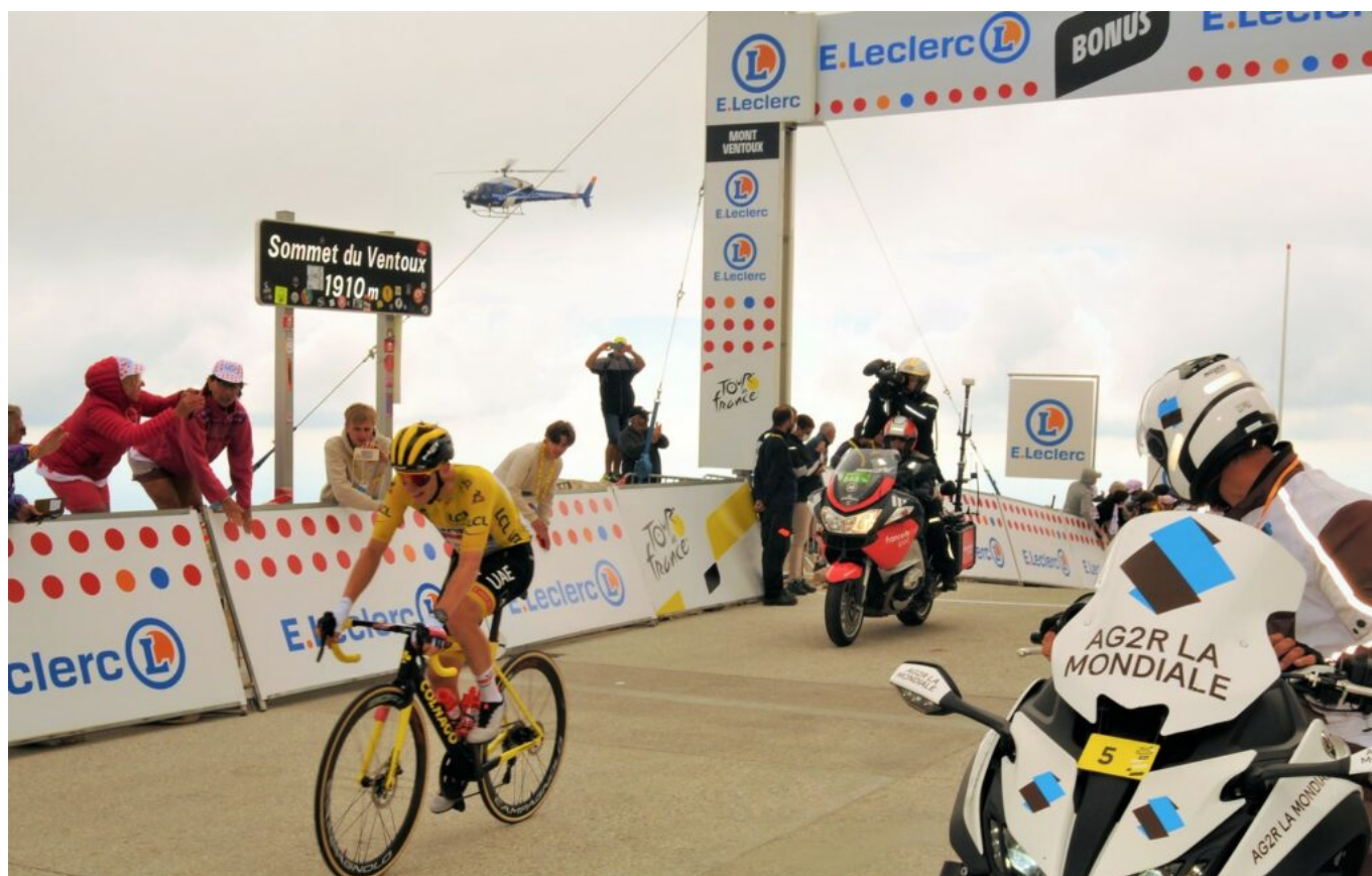
Tadej Pogačar, le maillot jaune, au sommet du Ventoux en 2021.