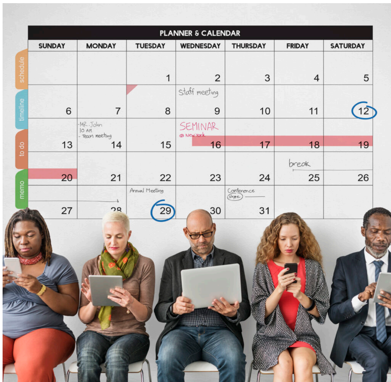
Calendar Planner Organization Management Remind Concept

Ecrit par Mireille Hurlin le 12 août 2024