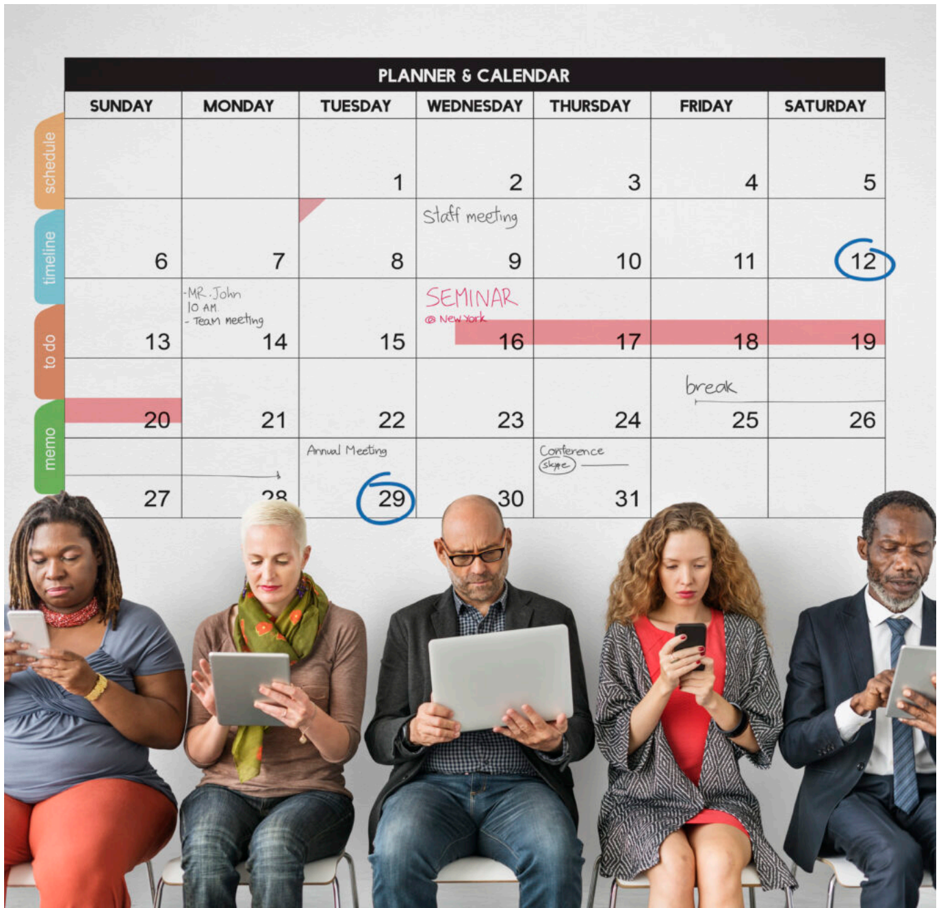
Calendar Planner Organization Management Remind Concept

Ecrit par Mireille Hurlin le 12 août 2024