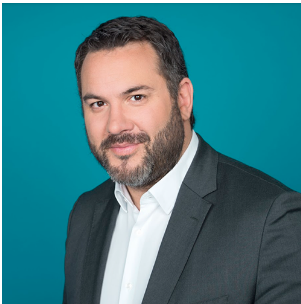
Bruce Toussaint, journaliste et présentateur chez BFM TV