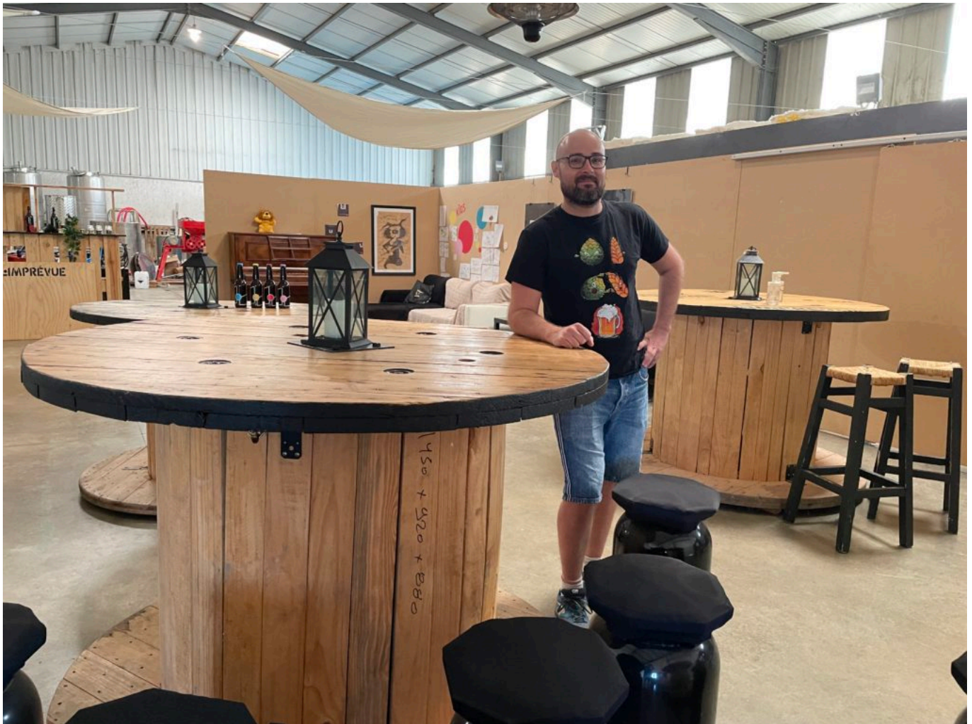
L'espace bar de l'Imprévue

plutôt attiré par le marketing, relate le gérant et brasseur de l'Imprévue. J'avais bien suivi des modules sur l'entrepreneuriat mais il fallait avoir une idée, un projet que je n'avais pas à l'époque. J'ai surtout travaillé dans le commercial, avant de rejoindre la passion familiale dans le vin -père et mère ayant acquis un domaine vinicole dans le Sud-Ouest, dans le Frontonnais- et m'intéressais de près aux outils vinicoles.»