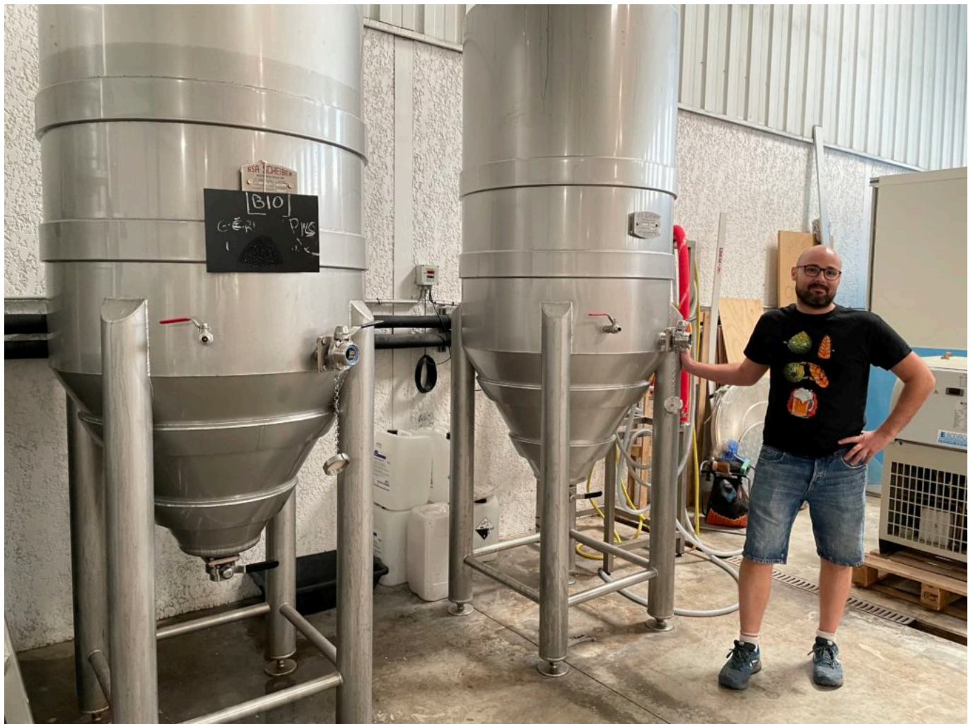
L'espace brasserie, outil de production de l'Imprévue parfois partagé avec d'autres brasseurs

Et la Voluptueuse Sweet Stout en rose -le rose pour la douceur et la volupté-est une bière brune (5% noire), douce et gourmande aux saveurs de café et de cacao avec une note de noix et à l'amertume modérée.