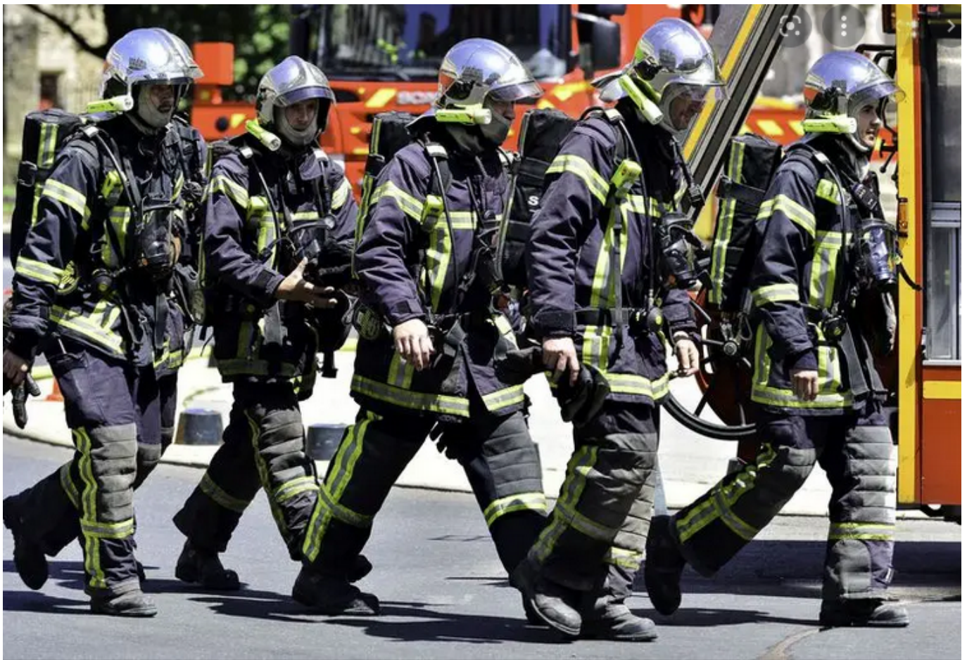
Les uniformes très techniques des pompiers

avons parmi nos adhérents une entreprise vosgienne ' Schappe Techniques ' située à la Croix-aux-Mines, qui fabrique le bouclier thermique de la capsule qui va sur Mars ! Il y a aussi les géotextiles utilisés en agriculture et en génie civil pour les routes, les ponts, dans le bâtiment, comme aussi les chaussettes à béton qui remplacent les tubes en acier pour construire les fondations. L'avantage du textile ? Il est à l'image de la soie de l'araignée : souple, adaptable, léger, il ne rompt pas et porte des poids extrêmement lourds. Nous élaborons des matières entrant dans le façonnage des équipements individuels de protection, uniformes de l'armée et des pompiers, particulièrement sur les tissus non-feu et résistant aux coups, balles, coupures, ainsi qu'aux températures extrêmes -hautes et basses-. Dernièrement ? Nous concevons des emballages et des enveloppes pour remplacer les plastiques désormais proscrits, comme pour les fruits et légumes vendus en GMS (Grandes et moyennes surfaces).»